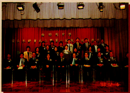
全體執委與主禮嘉賓合照

這天天氣雖然有點冷，但卻減不了老師的全情投入及興奮心情。早上十一時多，佈置的工作已密鑼緊鼓的進行著。平日毫不起眼的禮堂階