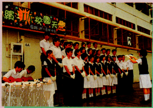
6B 獻唱 We Are The World

老師、劉偉雄老師、聶秀勤老師及林偉傑主任等為籌委會成員，經過多次會議，決議於十一月廿七日一整天為學生活動日，並命名為「續 FUN 校園天」，活動形式則由各學科及活動小組策劃。經多次會議後，各分科及組別提出各項活動建議，經籌委會討論及協調，再通過所有建議及編排老師分工、場地分配、活動宣傳及編訂該日全日程序。為加深同學對主題的印