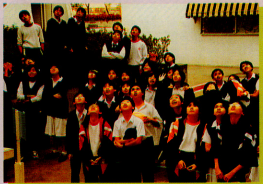
他們望甚麼？是「笨蛋跳」！

膳時間舉行「急口令」和「幸運輪」有獎遊戲宣傳，每位同學都在期待著「續FUN校園天」的來臨。至活動前一天，每位老師襟前都貼上印有象徵「續FUN校園天」的小海豚貼紙，同學見到都覺新鮮好奇，紛紛詢問老師是什麼，宣傳效果甚佳。