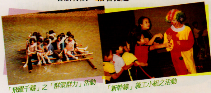
「飛躍千禧」之「群策群力」活動