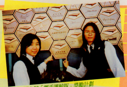
海洋公園主辦「攜手護鯨豚」獎勵計劃