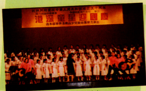
被邀參加金禧國慶在元朗聖修堂演出