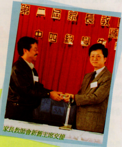
家長教師會新舊主席交接