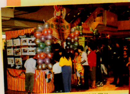
元朗區「清潔運動嘉年華」本校的攤位