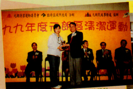
獲元朗區「清潔運動嘉年華」攤位設計比賽亞軍

綜觀本校的公民教育及德育的發展，學生已能自發地籌劃及積極參與各項活動，但我們相信這個只是起步，要獲得更豐盛的成果的話，還有待我們的悉心栽培呢！