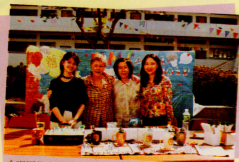
合唱團售賣紀念品