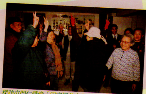
探訪屯門仁愛堂「田家炳老人中心」