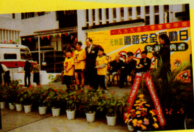
參加元朗少年警訊舉辦的「單車比賽」中獲獎