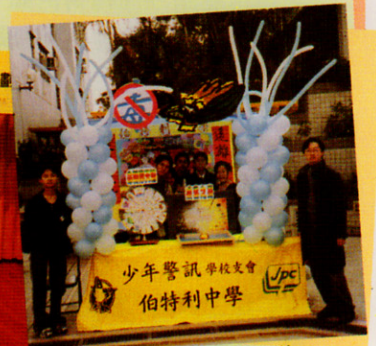
本校「少年警訊」的攤位設計