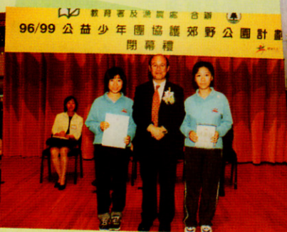
參加「郊野公園協護計劃」