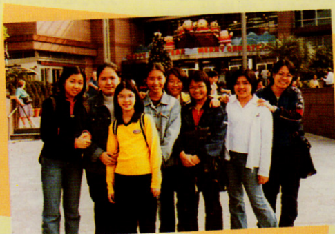
工作人員山頂半天遊

每個偷得浮生半日閒的午膳，我們都利用二十五分鐘一起練唱。女孩子嘛！聚在一起總免不了喋喋不休，在大姐姐團長們一聲司令下，她們又乖乖地、專心地練習了。遇上要趕緊地準備演出或比賽時，「刻苦」的訓練對於我們來說並不陌生：責罵、歡笑、疲累、振作、