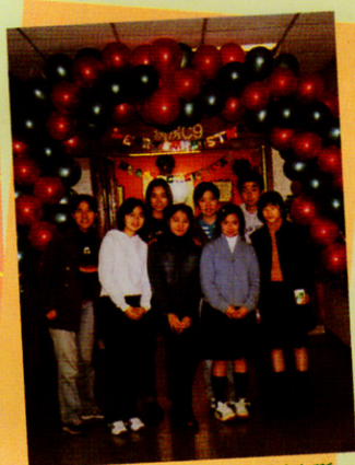
參加屯門醫院主辦的「病房聖誕裝飾大賽」