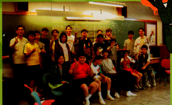
第三期動力部隊導師及部份隊員合照

我深深祝願同學們都能像歌詞中所描繪的一般——相信自己的「美麗」，生活得更有尊嚴，並能自愛。