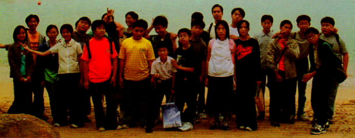
導師與隊員於聖士提反海灘合照

本課程名為〈動力部隊〉，顧名思義是期望參加者重視團體合作精神，彼此同心守望及支持，並發揮小組動力，對社群作出貢獻。由一九九九年開始，福音事工委員會曾經舉辦共三期之動力部隊訓練課程，每期共八課共八星期，每期共分兩組，每組約十二人，逢星期六於本校進行。