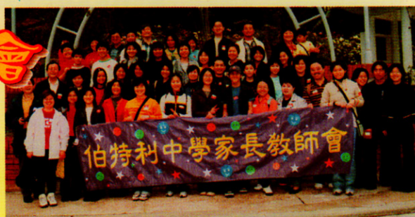
參加親子營大合照

在香港緊張的生活環境中，想找到輕鬆的日子真的不易，但畢竟家庭的融洽還是需要時間去維繫的。有見及此，本校的家長教師會於千禧年的三月十二日於保良局北潭涌渡假營中舉辦了一次「親子活動營」。