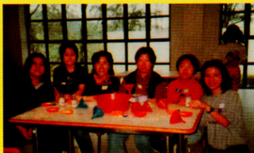
大棠親子營，成員參加彩沙畫合照

首先，來一個熱身的遊戲「捉蟲」，各位都必須聚精會神，專心聆聽這個「蟲」字，否則一旦被捉到便要淘汰，這個圈子又要變得細了！所以，整個捉蟲的過程可算是既緊張又刺激。接著是一個較輕鬆的遊戲「吹爆氣球」，除了負責吹爆氣球