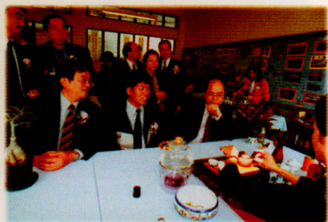
嘉賓參觀茶藝文化