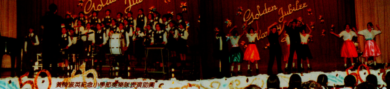
黃陳淑英紀念小學節奏樂隊表演助興