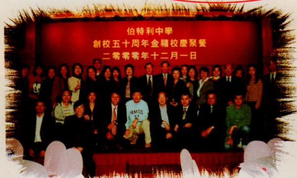
英文部第二屆校友大合照