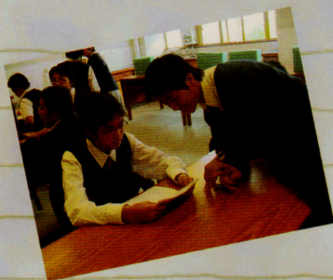
中一學長功課輔導計劃