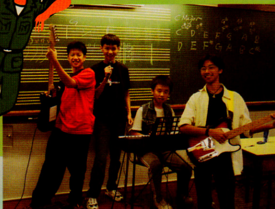
隊員於課堂後發掘及實踐自我興趣及潛能