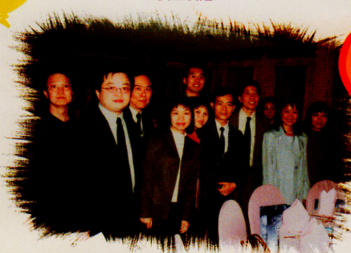
昔日師生 今日校友