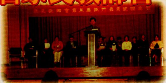
第三屆家長教師會執行委員會主席發言

十二月十七日下午三時正，本校家教會在學校禮堂舉行會員大會及第三屆執行委員會就職典禮。