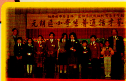
林校長、頒獎嘉賓及得獎學生