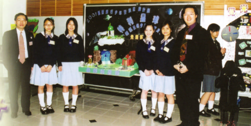
負責老師（右）及學生與評判（左）合照