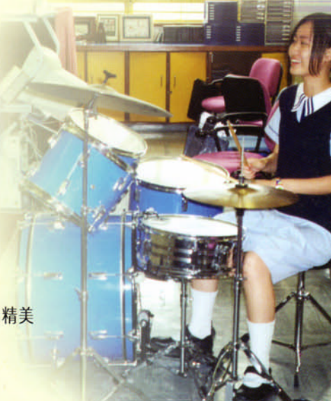
流行鼓班，女孩子也來學