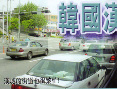
漢城的街道也很繁忙!

東大門 樂天世界 牙山水上溫泉 景福宮 戰爭紀念館 新村梨花女子大學 購物廣場大道