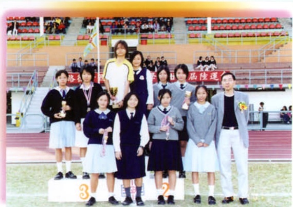
本校田徑隊參加路德會西門英才中學友校接力邀請賽獲女子組季軍