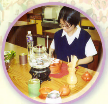
茶藝學會會員全神貫注示範茶藝