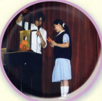
初中週會魔術表演