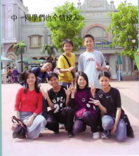
中一同學們也全情投入