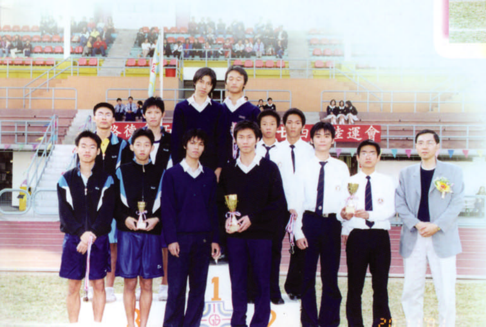
本校田徑隊參加路德會西門英才中學友校接力邀請賽勇奪男子組冠軍