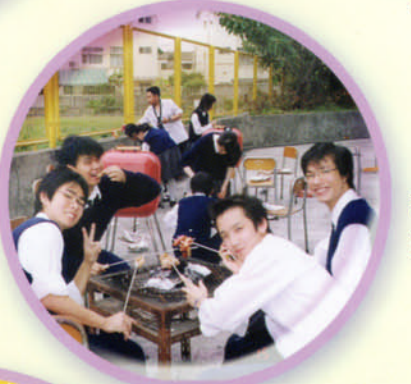
高中、初中同學齊享 黃昏燒烤樂