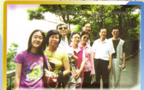
曲徑通幽風呼呼，山頂攬勝樂洋洋。