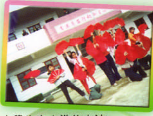
小學生高水準的表演