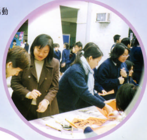
農曆新年齊來寫揮春