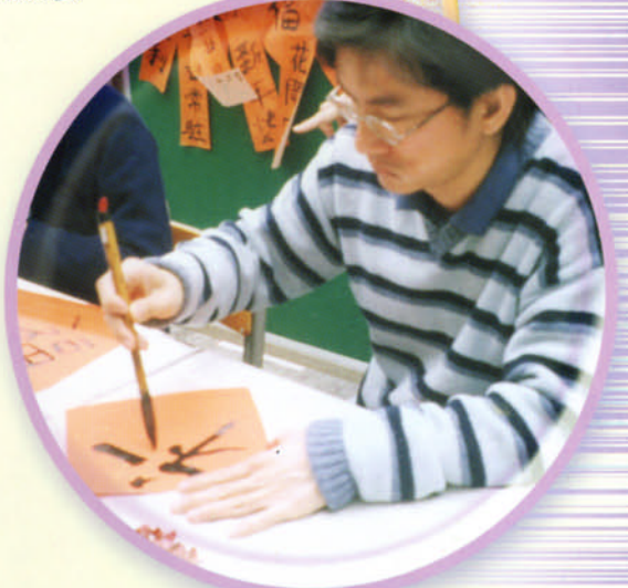
書畫班老師教授同學寫揮春