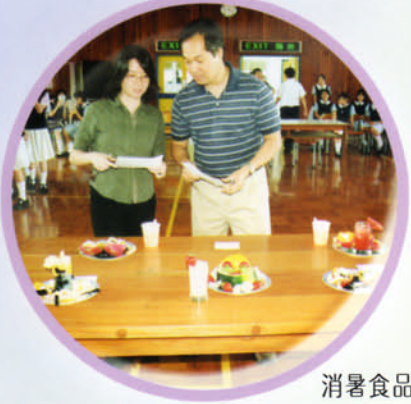
消暑食品創作比賽評判給分