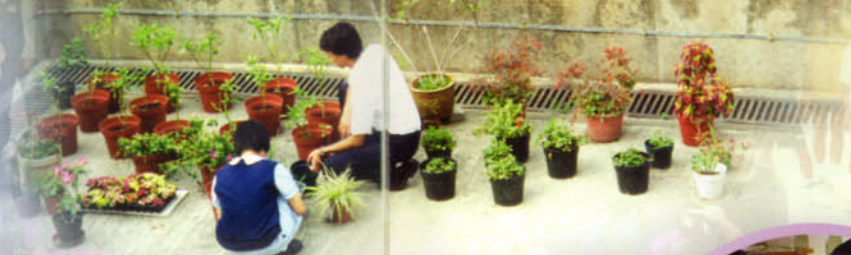
園藝組同學每天悉心打理盆栽