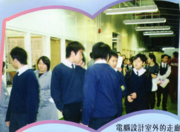
電腦設計室外的走廊