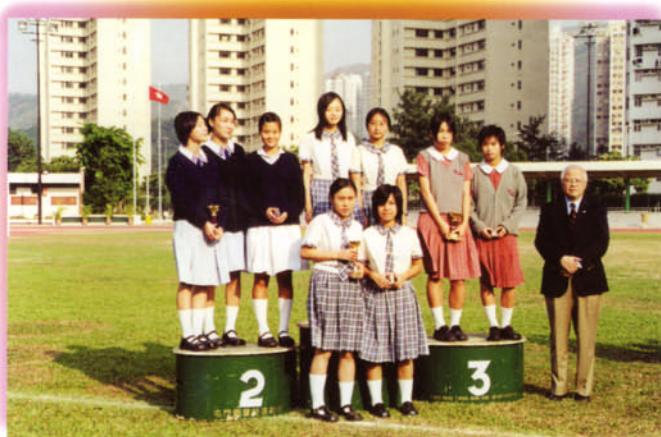
本校田徑隊參加明愛屯門馬登基金中學友校接力賽勇奪女子組亞軍