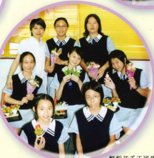
麵粉花手工班作品精美