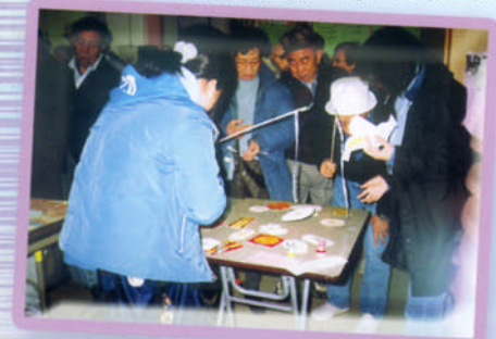
與智障兒童探訪長者