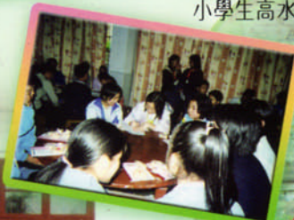
與新墟中學學生交流