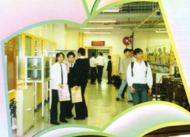
電機業訓練 中心工場