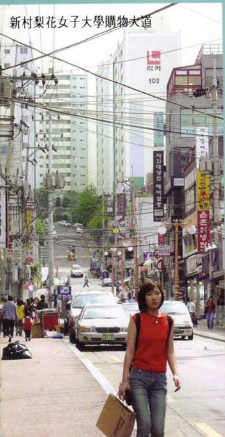
新村梨花女子大學購物大道

東大門 樂天世界 牙山水上溫泉 景福宮 戰爭紀念館 新村梨花女子大學 購物廣場大道