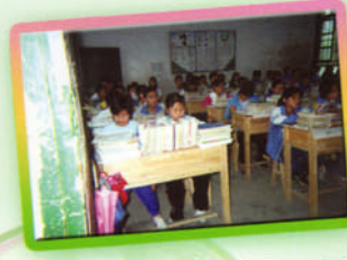
我校同學與新墟中學同上中文課