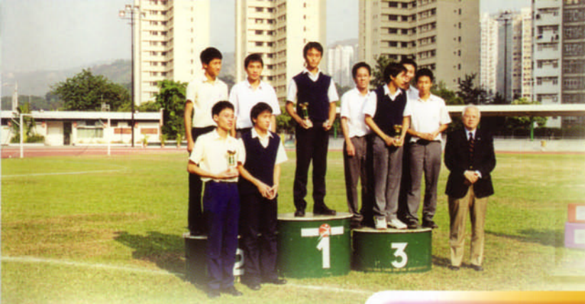
本校田徑隊參加明愛屯門馬登基金中學友校接力賽勇奪男子組冠軍