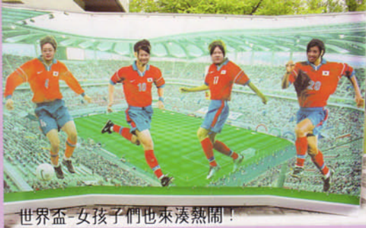
世界盃-女孩子們也來湊熱鬧!