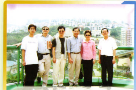
三月春光明媚，赤柱風景怡人。

四月十四日，本校家長教師會舉辦親子活動「港島名勝一日遊」，第一站是中山紀念公園，接著乘車上山頂遊玩，覽盡維港美景之後一起乘車到赤柱午膳，飯後漫步小鎮名勝，悠然怡人。最後一站是淺水灣，小朋友赤腳堆沙，不亦樂乎，直到夕陽西下，大家才盡興而歸。