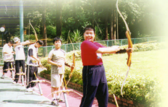
初中童軍團戶外活動