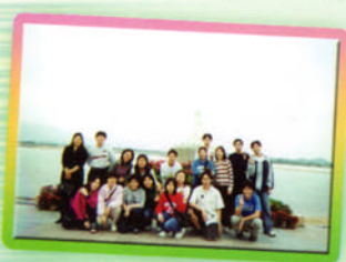
河邊漫步，回程留影！