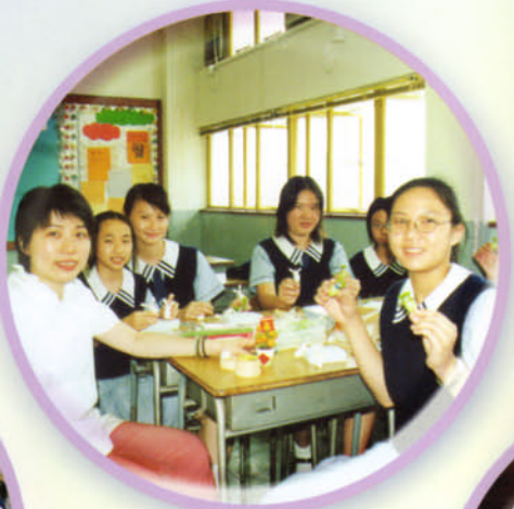
麵粉花班導師悉心教授