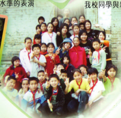
福塘新溪小學舊址