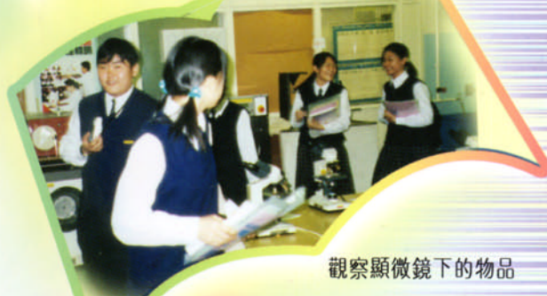
觀察顯微鏡下的物品