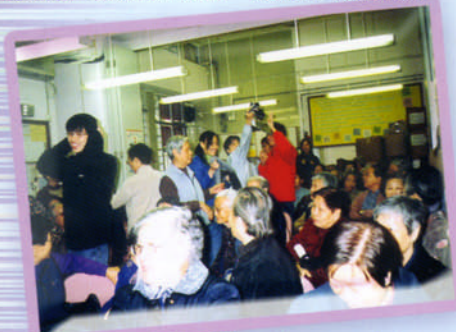
長者聚精匯神「釣」健康食物