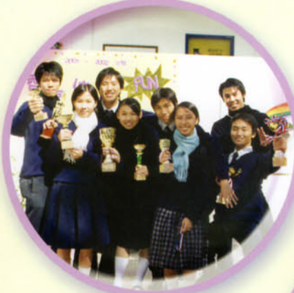
田徑組獲獎， 笑逐顏開