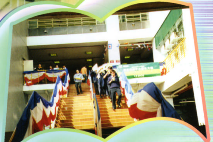
參觀完畢，同學從大樓行落正門