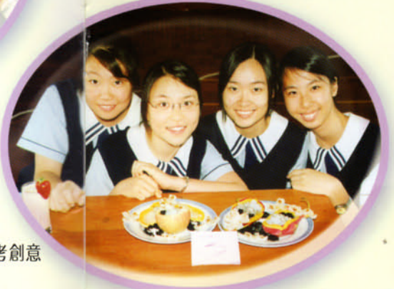
夏日消暑食品考創意