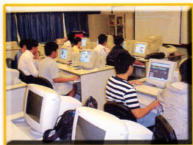
電腦網頁組別之隊員分組上課時情況

本年度學生團契小組仍與聖經科配合，以小組模式進行，參加者可選擇以小組成績代替遞交聖經科專題企劃。上學期共有165位學生報名參加，共分16組，由本校校牧及基督徒老師擔任導師，現時約有111位穩定出席每次小組課程，內容包括：初信栽培造就課程、福音慕道小組課程及各級進深課程。除現有組員外，福音週後另外有17位同學願意加入小組，將安排下學期入組或另開新組。學生透過小組課程除了對福音及聖經有進深之認識外，亦幫助學生與導師建立良好關係，在情緒及心靈上得著支持，並建立正確人生觀及價值觀。除小組課程外，本學期亦舉行多次合組及合團活動，內容包括詩歌分享、手工製作及慶祝會等，以維繫同學之關係，彼此支持及守望。