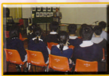
聖經科講座：十一月一日邀請楊慶球博士主講神人兩性的基督