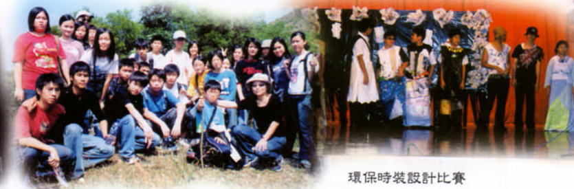
環保時裝設計比賽