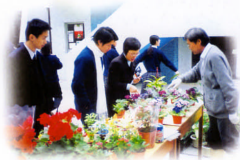
花卉展覽老師也來湊熱鬧