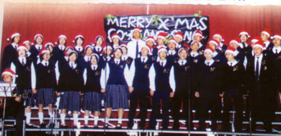
5C 班聖誕班際合唱比賽