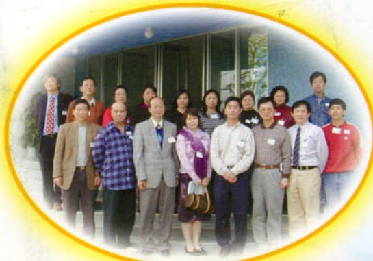
第四屆家教會全體執委