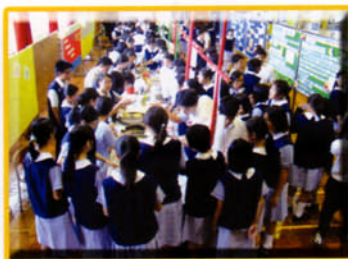
福音週攤位遊戲場地

第十一期動力部隊（二零零二年九月份至十一月份）已順利舉行，內容以網頁製作及基本鋼琴彈奏為主，平均出席率達8至9成，獲取證書有12人，勤到獎共12人，而其中兩位亦獲取優異成績。學生投入各項程序及自由活動，個別對參與宣道會錦繡堂少年崇拜及團契亦感興趣。其中，中一級學生亦相當主動，嘗試積極邀請其他同學參加。第十二期動力部隊（二零零二年十二月至二零零三年三月）現正開始舉行，本期以認識醫療及急救常識為主，並附以堂上實習，以預備本年三月一日參與屯門醫院兒童福音事工活動中擔任義工，現有二十二位隊員參加，其中包括四位校友，反應不俗。