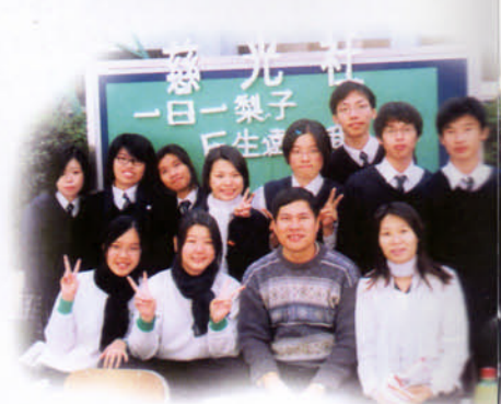
慈光社於學生週舉行攤位