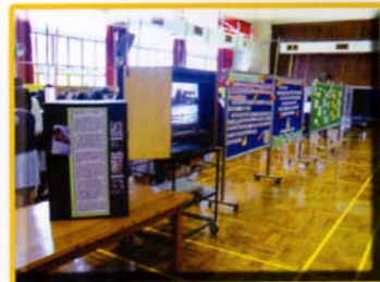
福音週福音展板展覽場地