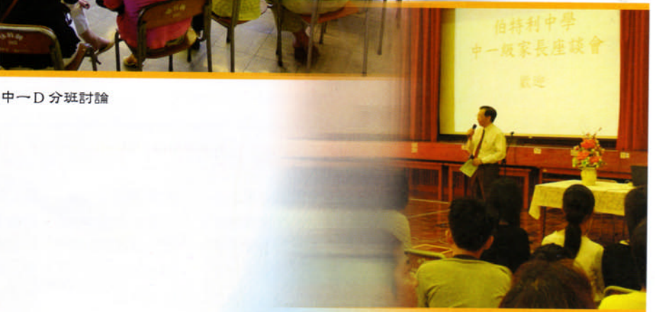
中一級家長會——校長致詞