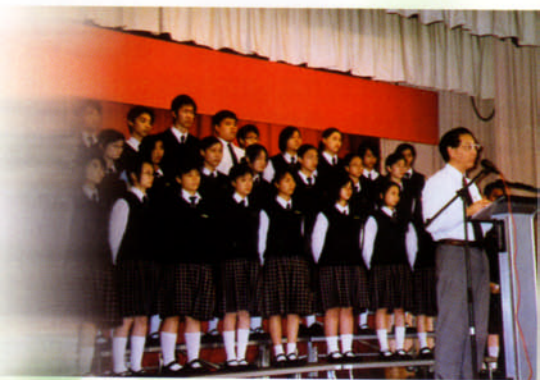
風紀隊就職典禮，校長訓勉