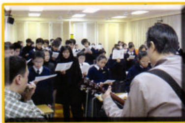
聖誕合團慶祝會：校牧帶領團友聖誕感恩崇拜獻唱綵排