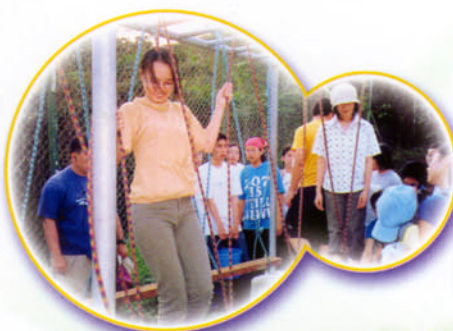
組員合作沿繩下降

我在這個領袖營裏可以認識到一些高年級的哥哥姐姐，還學到很多處事的態度，例如：合作精神。第一天的障礙賽可以鍛煉自己的意志力，如果只得一個人去做，就會很困難，大家合作，才可以成功。在第二天進行遠足時，如果意志力較弱和沒有隊友的鼓勵，我們就不能行完全程。因為當天天氣較差，剛下完雨，山路很濕滑，而且風勢很大。我們的導師會常常指出我們的好處和壞處，讓我們自我檢討。組員會互相幫助，互相鼓勵，提升活動的歡樂氣氛。這些活動令我提升了自信心，加強了自律性和毅力，所以我會是一位好領袖。