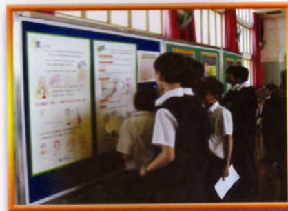
學生觀看性教育展板