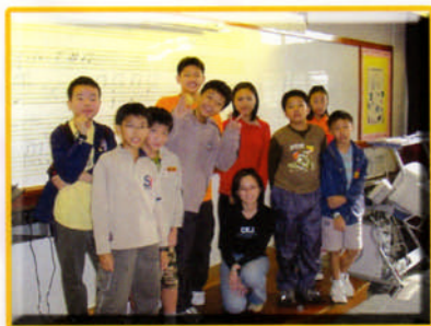
基本鋼琴彈奏組別導師與隊員合照