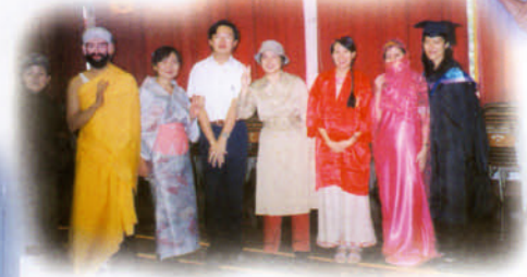
英文學會萬聖節活動