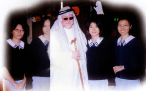
英文學 萬聖節活動