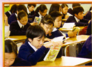
學生聚精會神閱讀課外書