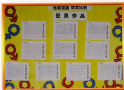
性教育週徵文比賽得獎作品