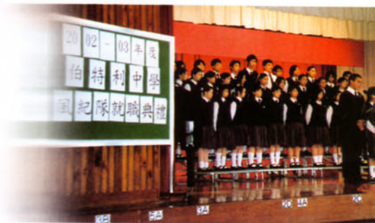
2002-03年度風紀隊就職典禮，新任風紀隊長宣誓及展望未來

風紀隊的精神乃是要維持學校的良好紀律，締造優良的校風，藉著校方的全力支持和各同學的合作，期望風紀隊各隊員能「全力以赴，做到最好」。