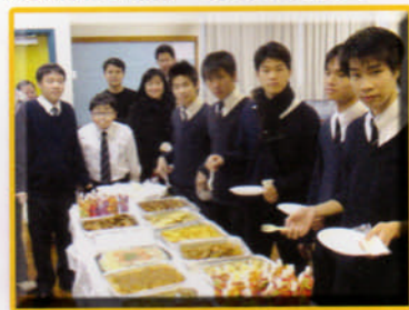
合團聖誕慶祝大會