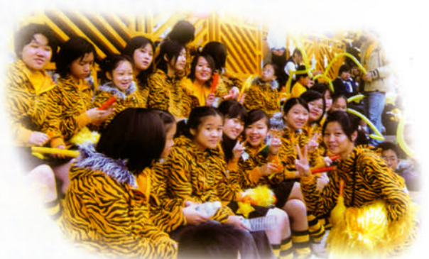
啦啦隊於運動會看台