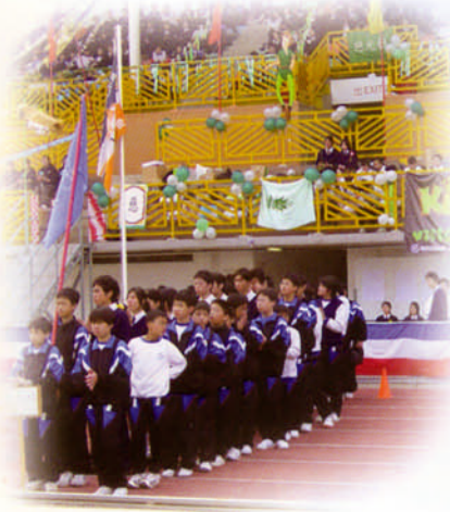
中一級運動員進運動場排練