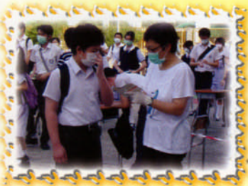
老師檢查學生體溫紀錄表。