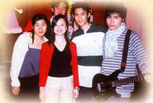
校友也回來歌唱表演