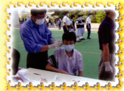
老師量度學生體溫。