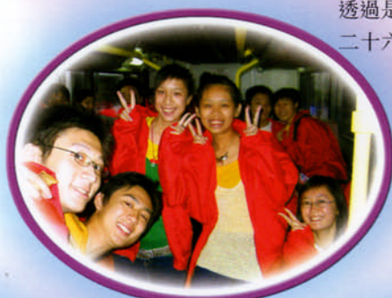
在巴士上等候同樣快樂

近來不少本港學生回國內升讀大學，因此本組於三月六日邀請「廣州暨南大學招生辦」蒞臨本校，向高中同學主講國內升學講座。透過是次講座，幫助同學掌握回國升學資料，同學獲益良多。三月二十六日中五同學更獲發《內地升學指南》書刊。