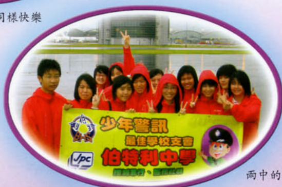
雨中的機場停機坪