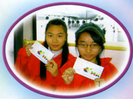
依依不捨地離開機場停機坪，我們亦要心連心。