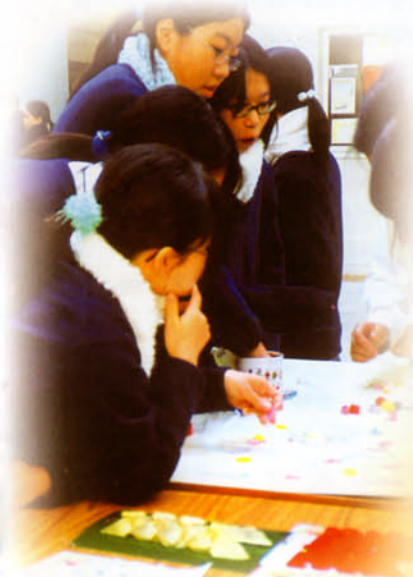
午間活動——鬥智鬥力