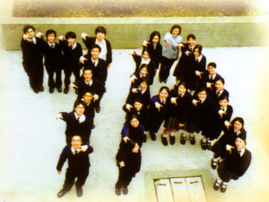
7A班大合照——學生活動籌委會成員