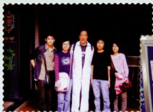
6A同學進行新界古跡考察活動時巧遇教統局李國章局長