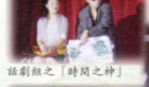
話劇組之「時間之神」