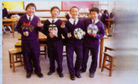
同學們高興地展示自己的作品！