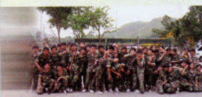
Who's the best? We are!