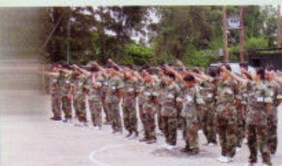
共同承諾——「做到最好」！