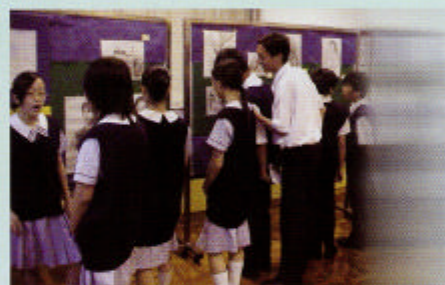
在畫展中同學正欣賞同儕的佳作！