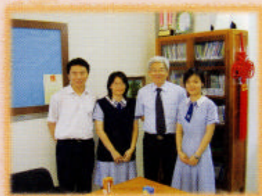
樓校董與校園記者合照

樓：因為我覺得自己在教育崗位工作上，任職校長有25年、從事教育工作30多年，工作開始枯燥和疲累，而我亦是多間學校的校董，時間上不容許，現在感到這些工作後繼有人和學校發展開始上了軌道，於是便作出這個決定。