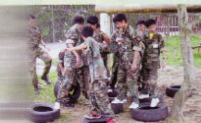
齊心合力，完成任務！