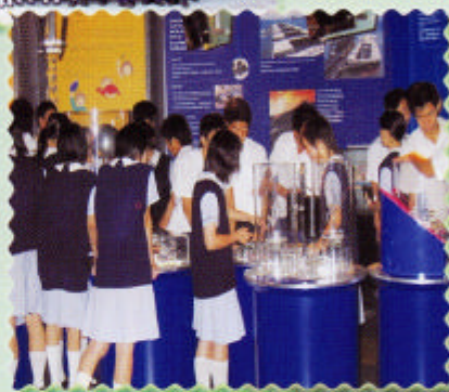
學生透過「電力供求遊戲」了解維持電力供求平衡的重要，以及怎樣才可取得最佳平衡。