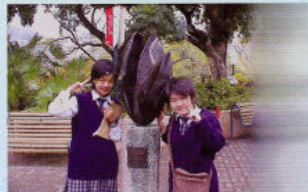
九龍公園內的雕塑真有趣！