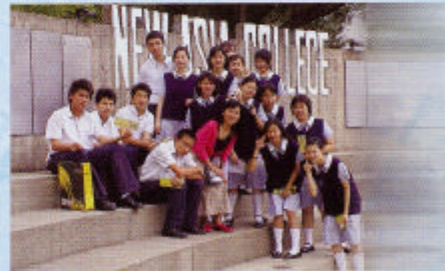
參觀完中文大學藝術展當然要來一幅大合照！