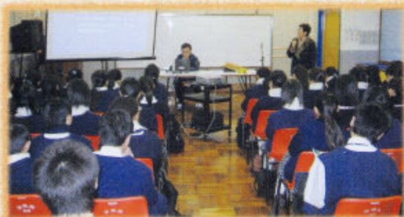
二月四日中三級講座職業訓練局介紹中專課程

在成人的現實世界裏，人間事物充滿着變化與不確定感，加上社會上隱隱約約存在着「不勞而獲」的價值觀，橫財就手，一日暴富。因此學生究竟選擇什麼樣的方式來面對他們的未來呢？是「一切到時候再說吧！反正船到橋頭自然直！」；還是「胸有成竹，知道下一步自己該怎麼辦！」。透過專業的服務，學校、老師和家長的合作，才能使學生邁向自己的理想。