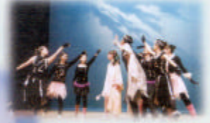
「今天」遇上「時間之神」