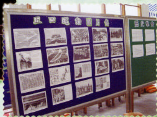
歷史學會五四圖片展板