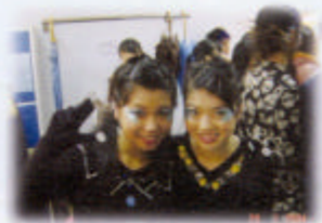
後台花絮——中一同學也有參加