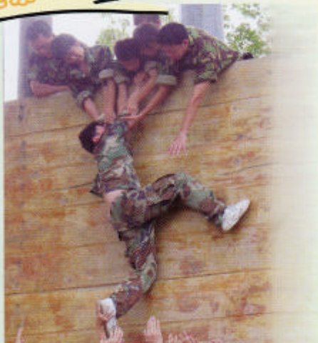
伸出手來，我們會幫你的！