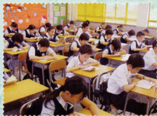
晨讀計劃——學生專心閱讀