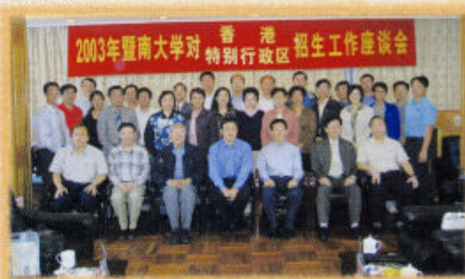
本校升學就業輔導主任參加二〇〇三年暨南大學接待香港特別行政區招生座談會