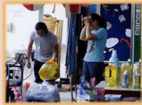
工作人員正為居民回收的廢物磅重。