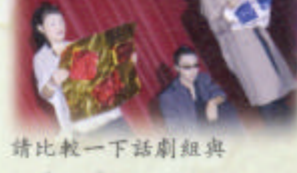
請比較一下話劇組與創藝組「時間之神」之造型