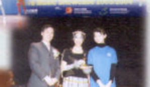
時間之神遇上「快樂」