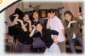
幕後工作人員亦有活潑的一面