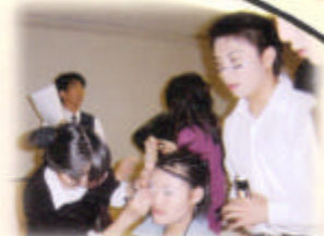
化妝部為演員造型