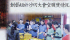
創藝組於沙田大會堂獲獎情況