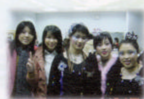
其中兩位時間之神