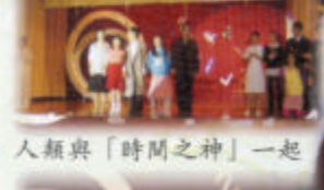
人類與「時間之神」一起