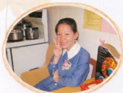
文校友現任屯門醫院註冊護士

伯特利是我讀書生涯裡最開心的時間。在伯中，我認識到一班志同道合的好同學，當時伯中學生是不可出外吃飯，所以同學們更可以建立更深厚的感情。我們一同上學、放學，甚至假期我們都差不多日日見面。記得有一我們biology group要到曹公潭附近出field trip一個星期，maths group的同學也說掛念我們，要到營地探我們。畢業後，我們各散東西，大家有大家的工作，偶爾也有出來聚舊。我亦都選擇了我其中一個志願，成為了一個註冊護士。當上這個職業，大家都以為我會越來越冷血，但是我認為我只會越來越細心及更感同身受(empathy)。我覺得我很適合當護士，一來我喜歡輪班工作，二來這份工作有極大的挑戰性。首要條件就是要不怕血及骯髒的東西，雖然放工回家會好疲累，但是幫到人也覺得值得。