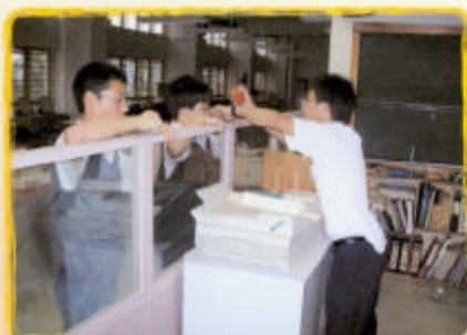
學生參與建立電腦輔助設計中心工作