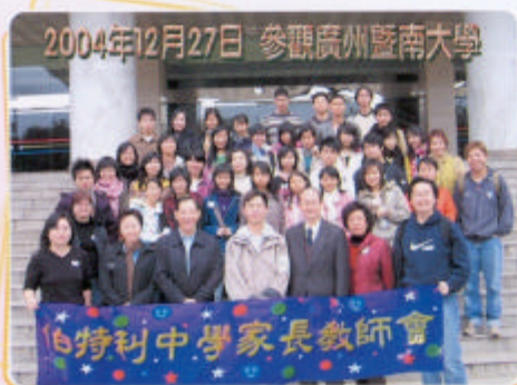
2004年12月27日 參觀廣州暨南大學