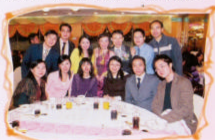
文雪頤於04年底結婚校友到賀

伯特利是我讀書生涯裡最開心的時間。在伯中，我認識到一班志同道合的好同學，當時伯中學生是不可出外吃飯，所以同學們更可以建立更深厚的感情。我們一同上學、放學，甚至假期我們都差不多日日見面。記得有一我們biology group要到曹公潭附近出field trip一個星期，maths group的同學也說掛念我們，要到營地探我們。畢業後，我們各散東西，大家有大家的工作，偶爾也有出來聚舊。我亦都選擇了我其中一個志願，成為了一個註冊護士。當上這個職業，大家都以為我會越來越冷血，但是我認為我只會越來越細心及更感同身受(empathy)。我覺得我很適合當護士，一來我喜歡輪班工作，二來這份工作有極大的挑戰性。首要條件就是要不怕血及骯髒的東西，雖然放工回家會好疲累，但是幫到人也覺得值得。