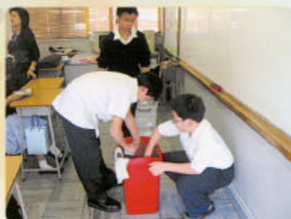
清潔課室，義不容辭！