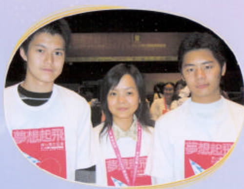
三位同學在會場拍照留念