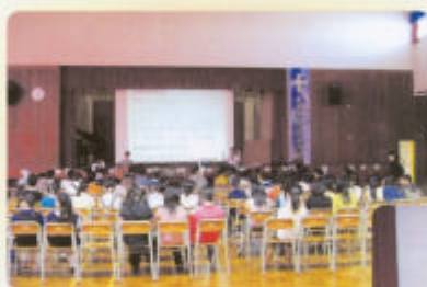
十月份少年福音綜合聚會情況

十月至十二月份〈少年福音綜合聚會〉已順利舉行，參加人數由約50-100位不等，主要是本校師生。其次，〈活泉福音音樂小組〉亦一連三次在聚會中負責獻唱及伴奏環節，雖然隊員並非專於樂器及歌唱，然而本著服侍神及獻上恩賜的使命，憑信心將自己最好的擺上，勇氣可嘉。在過程中他們亦經歷到神的同在和事奉的喜樂，實在要為此感恩。