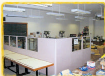
電腦輔助設計中心外觀