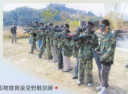
動力部隊隊員接受野戰訓練 ● 隊員與教會參加者一同合照