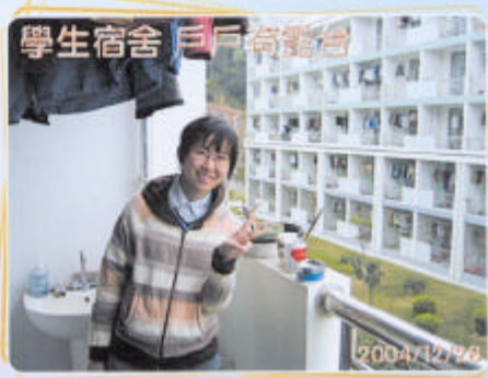
學生宿舍 戶戶有露台