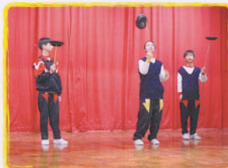
我轉，我轉，我轉轉轉！