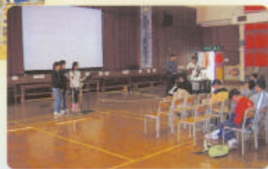
〈活泉福音音樂小組〉組員負責 〈少年福音綜合聚會〉詩歌分享環節