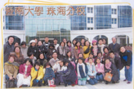
暨南大學 珠海分校