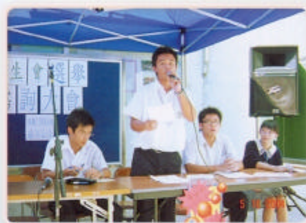
學生會選舉諮詢大會