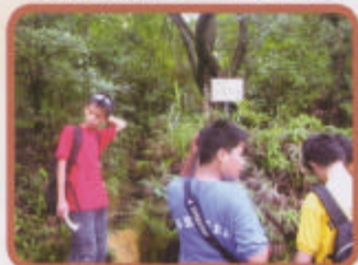
祕道入口? 究竟怎樣入去呢?