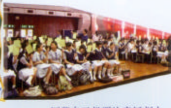
同學自己投票決意話劇中 主角的選擇