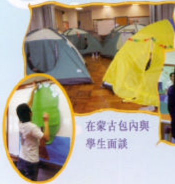
在蒙古包內與學生面談

青年導航員能為學生提供合適的服務及跟進。完成分流評估後，再安排小組活動刺激學生為前路規劃及轉變作好準備。3-5月間本組再與該中心舉行工作坊15次，共60位學生參加。5月18日，推出中三模擬人生旅程大型攤位活動。導航員並將於八月初學校中三升中四派位結果公佈時設立「學生派位打氣隊」，支援有需要的學生及家長。