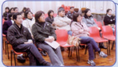
中三家長日家長講座 香港職業發展服務處社工為學生家長提供就業市場資訊及探討畢業同學在求職路上遇到的困難及支援方法