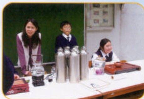
看！已經準備就緒，讓同學一起品嚐綠茶涼飲！

想認識祖國不一定要走到老遠的內地，因為同學可以透過參與本年3月14日至3月18日的「中國文化多面睇」活動，從不同的角度，如文化、藝術、飲食、棋藝，認識中國。參與的同學都能樂在其中。