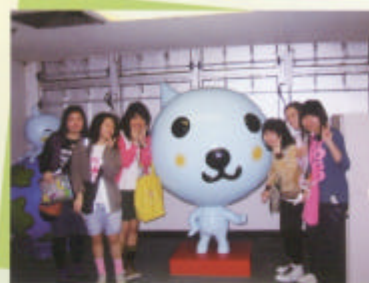
汽水廠——Q版公仔人見人愛