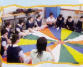
學生認真地思考問題