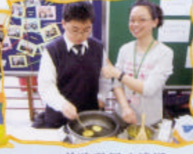
前路發展八達通 午間精選活動-特色小食齊齊學