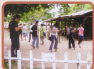
高跳比賽! 家長、學生齊參與。