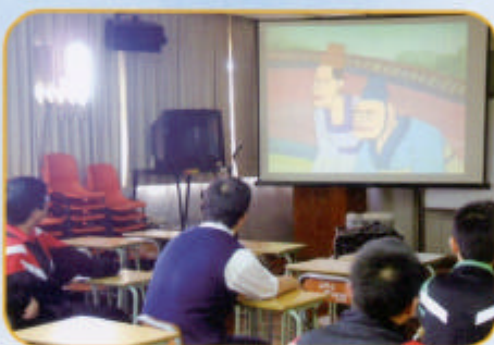
同學專心欣賞民間故事