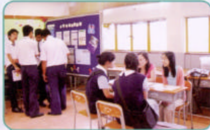
香港專業教育學院講師及本校校友介紹該學院課程