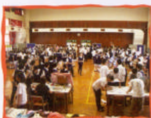
同學積極參與活動情況

現今的教育改革強調學生的學習經歷，本組因應這個方向，於今年5月18日與香港基督教服務處「有網能量」青年導航及發展中心聯合舉辦「中三模擬人生旅程」的大型攤位活動。模擬人生的旅程的活動包括各個人生不同階段的「攤位」：中學、專上學院、大學、工作等，讓學生經歷由中三開始的人生旅程，令他們體驗升學派位和工作選擇的過程，並讓他們感受一下面臨人生抉擇時的心情。