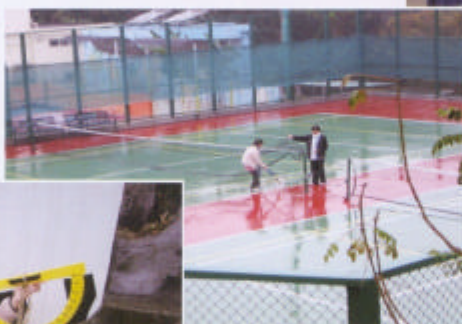
同學在營內進行實地的量度，收集數據。