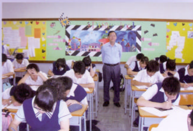
王副校長攝于課室

對於教不同的學生時，副校長可謂有教無類。對他而言，同一班的學生中，一定會有有些是積極的，有些是不積極的，他覺得只可以督促他們，很難去感化學生從沒興趣變成有興趣的，而且也需要時間。因為同學缺乏學習動機是很難令他們改變。但如果同學是有學習動機的，假使他們成績不好，是一定有方法教好的，要取得及格其實是一件容易的事。