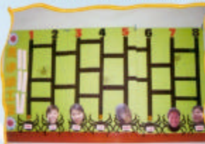
一班幹勁十足的社工

由幼稚園、小學至中學三年級，所有學校修讀的科目均是必修的，無需選擇；但到中四卻要選擇修讀文科、商科或是理科。因此中三是人生成長和學習過程中一個關鍵的階段。其實，這是個很好的機會讓學生去為自己的未來打算一下，想一想自己有甚麼理想，希望將來的職業是甚麼。可是，這並非件易事。有部份學生到選科關頭仍未知道自己想讀些什麼，亦不知他日想幹些什麼；因此當面對抉擇時，很多都在缺乏周詳的考慮下作草率決定。