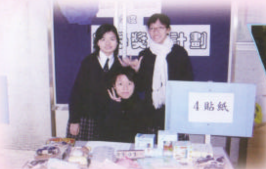
攤位活動工作人員