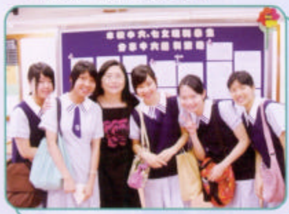
本組老師向中五同學講解中六收生程序