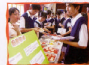
廚藝學院及招聘見習廚師攤位

半天的活動既緊密又充實，但因時間有限，同學們都感到意猶未盡。當然，檢討也是活動的重要環節之一，經過「3個小時的模擬人生旅程」後，學生分組共同檢討。學生參與活動固然十分投入，在分組檢討時，他們的積極及認真都令我留下深刻的印象。