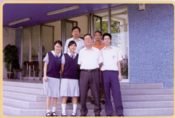
王副校長與校訊記者在學校正門合照

最後，王副校長忠告學生學習的時候要有自信和學習動機，成績便會進步。他經常都向學生講一個例子，就是他同班有一位同學，由內地來香港就讀高一，對英文完全不懂，他家境窮困，沒有錢去補習，但他勤力學習，故英文進步得很快。他中學畢業之後，讀大學是讀英文系。由此可知，不要常常說自己這些不行那些不行，問題是自己有無決心去追回之前所失去的知識。王副校長希望大家要有自信和決心，抱住這些態度去學習，一定會有成功的一天。