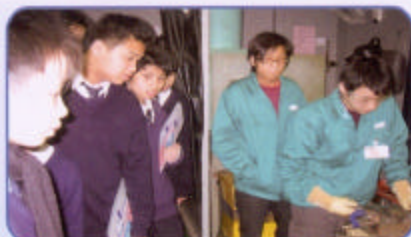
65位中三同學分別參觀建造業訓練局屬下上水訓練中心及葵涌訓練中心