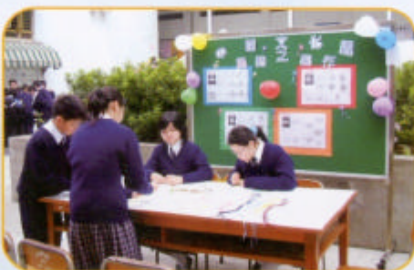
工作人員努力準備攤位