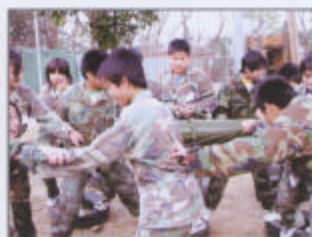
齊心做，一定會成功!