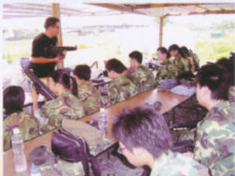
風紀隊軍事訓練教官訓話

自2004至2005年度開始，本校著重互相關愛的重要，期望老師之間、同學之間以至師生之間均能在一個和諧溫馨的校園裏學習、彼此尊重。