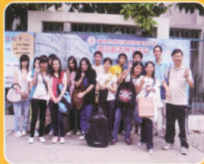
離開前來一張集體照