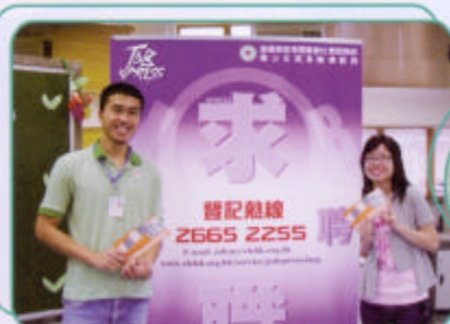
基督教香港信義會青少年就業輔導服務介紹「想創空間-現代師徒計劃」