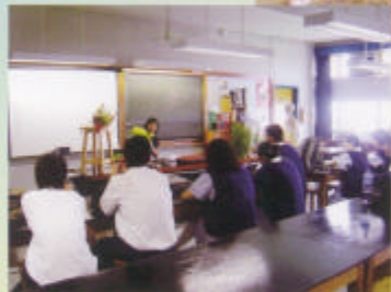
生物學會有機種植工作坊

生物科老師一向致力培養同學對生物的興趣和對大自然的欣賞，至於全方位學習更不遺餘力，務求讓學生有更多機會親身體驗真實環境，課堂以外經歷學習。在本學年裏，我們舉辦了不少教學活動，包括參觀有機農場、體驗有機農耕、參觀鶴藪綠田園有機農場及生態漫遊、參觀西貢蕉坑獅子會自然教育中心、有機耕種工作坊、長洲生態考察香港岩岸生態、生態講座「紅火蟻對生態的影響」、「531無煙校園」運動、生物學會的種植比賽和溫室種植活動等，活動種類多元化，參與的學生橫跨中一至中六，望能擴闊同學的學習空間、提升觀察力、合作性和同儕學習的精神提高學生對生物科的興趣，將有助學習，裨益不少。