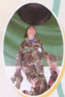
「黑球行動」—考驗大家合作性。

在此我感謝教官和老師，還有一些好隊員，最後更謝謝在我們背後默默耕耘的一些廚師，煮了那麼多美味的食物給我們吃。在未來的日子我希望也可以很像今天一樣過得那麼充實!