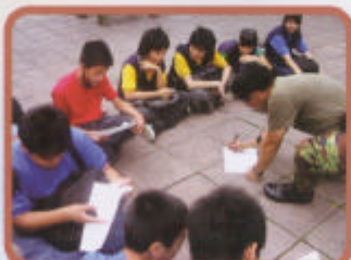
大家先研究地圖, 才可行動!