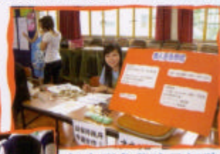
個人形象學院及招聘美容助理攤位