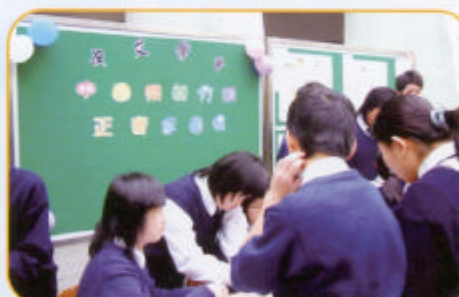
同學們投入正音逐個捉的活動