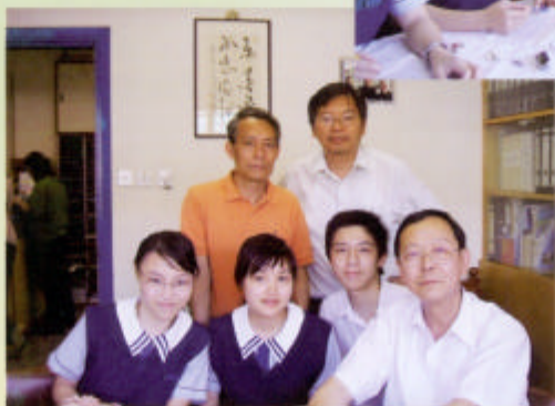
王副校長與校訊記者合照