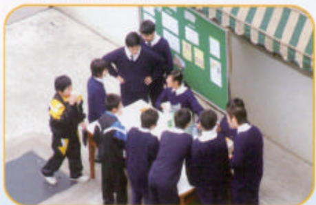
你嚐過由同學親自炮製的豆漿嗎？