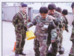
一定要完成任務，大家要努力!