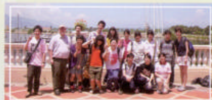
A group photo by the marina

We went to Chilli'n Spice for lunch because we were very hungry. In the afternoon we did a treasure hunt and went to Golden Beach. I enjoyed these activities. It was wonderful.