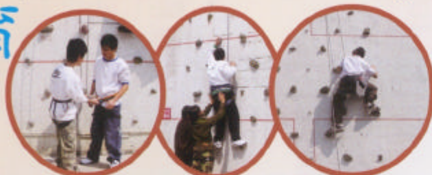
扣好安全帶才可攀爬! 努力! 向上攀吧! 蜘蛛俠來呀!