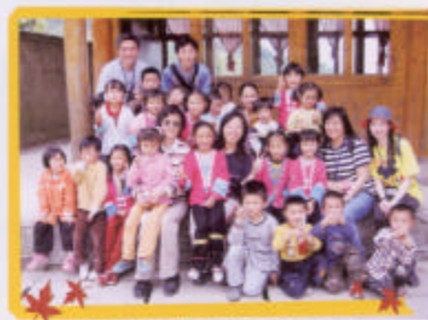
六位老師與當地學生合照

學校方面，對於那兩所小學的老師，印象較深刻，尤其是平安小學的那位年青女校長，看到她說話時的那份自信，相信他們的小學，必能不斷進步。至於那所重點中學，最欣賞還是那用粉筆畫在壁上的、色彩斑斕的壁報了。