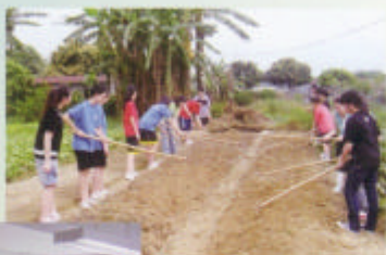
生物學會參觀 有機農場