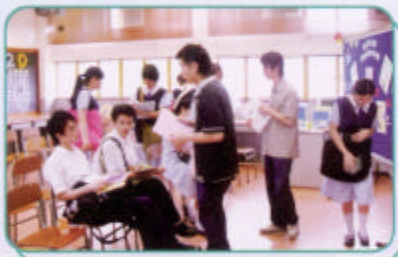
嶺南大學持續進修學院代表介紹副學士學位先修課程

近年來，學生面對的學業壓力愈來愈大，因為香港經濟不斷轉型，不少同學苦讀了幾年的「專業」，畢業後因為社會的需求已經改變，很多時未能學以致用。另外失業率高，謀事難，是一個不能否認的事實。所以，會考放榜後能否認清目前的形勢、緊守自己的方向、抓緊面前的機會、為將來鋪一條比較易行的路，對同學來說就更加有需要。為協助應屆中五同學尋求出路及紓緩壓力，升學及就業輔導組於二零零五年六月四日(星期六)於學校舉行「2005 中五升學就業展覽—轉出未來工作坊」，是次工作坊內容豐富，有放榜前心理準備、放榜日的選科策略，也提供本地及外國的升學資料、各進修門路，就業錦囊；另外除本組老師向應屆會考生講解中六收生程序外，還邀請了香港專業教育學院代表介紹香港專業教育學院課程、嶺南大學持續進修學院代表介紹適合中五畢業生就讀之嶺大課程、副學士學位先修課程；明愛元朗社區進修中心、思亞國際教育中心代表介紹海外及國內升學途徑；基督教香港信義會青少年就業輔導服務介紹「想創空間—現代師徒計劃」，並有社工提供心理輔導。