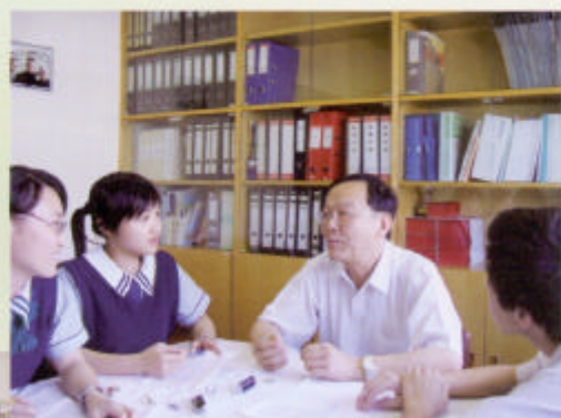
王副校長接受訪問時攝

被問到面對退休有甚麼感受時，他平靜地說每個人到達某個年紀，都會進入人生的另一階段，即使他再多教一兩年書，最後都要退休，故順其自然是最好的，也沒有甚麼太大的感受。但要與學生及共事多年的同事分離，始終會有些捨不得的。而退休之後，他暫時會休息一下。不過，他說以自己喜歡工作的性格，是否會另覓一份工作仍是未知之數，因為現時在香港找工作不是容易之事。他說退休後若找工作，一定不會是教書的，因為畢竟自己當教師已經很多年了，很想嘗試其他類型的工作，改變工作環境。