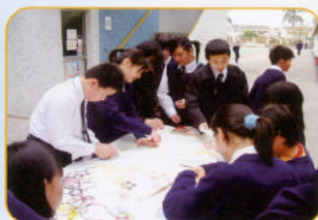
原來中國繩結工藝實在不簡單！