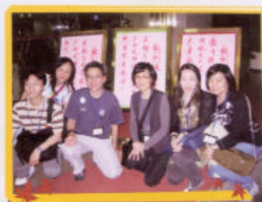
六位老師在廣西龍勝留影