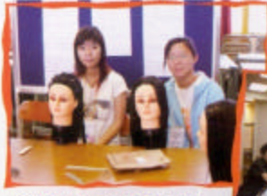
髮型設計學院及招聘髮型助理攤位