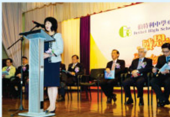
余羅少文女士致辭