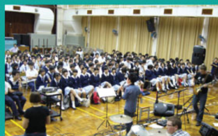
青年歸主協會在初中級主領信仰講座