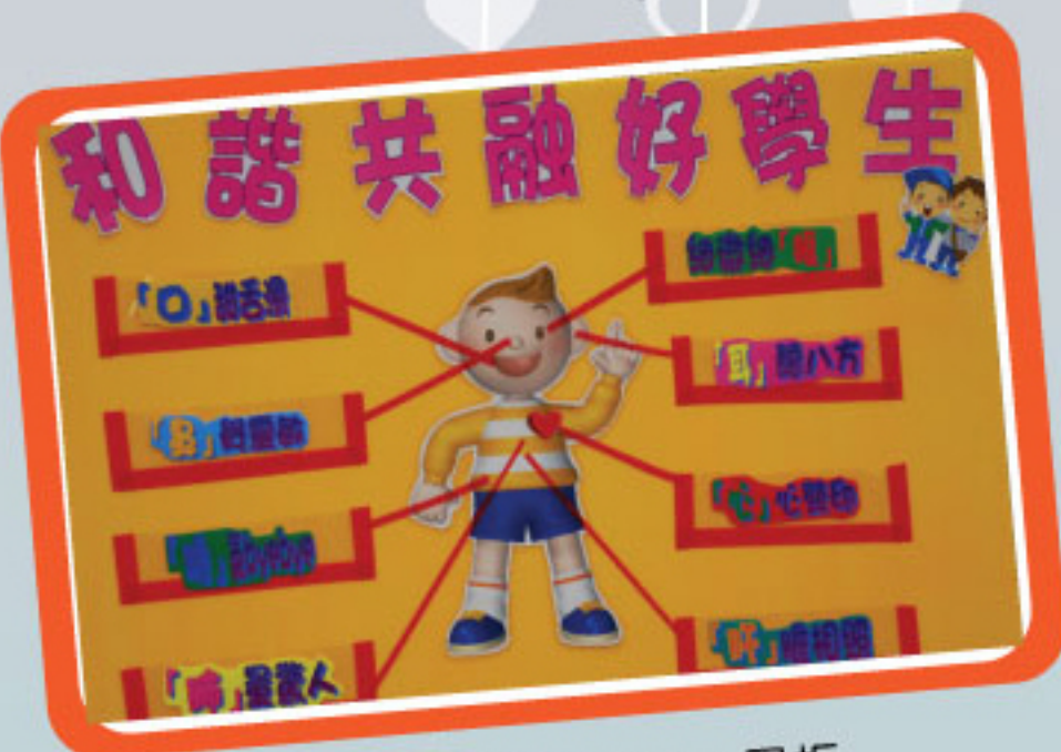
「和諧共融好學生」展板