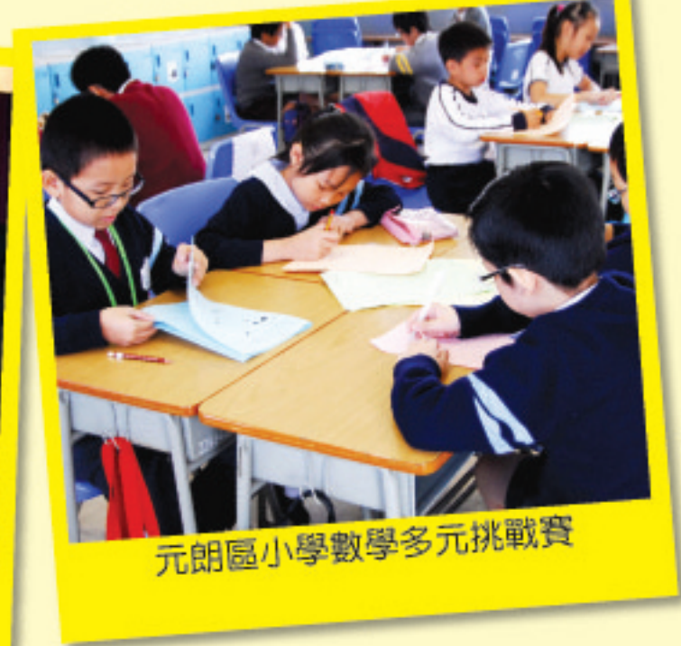
元朗區小學數學多元挑戰賽