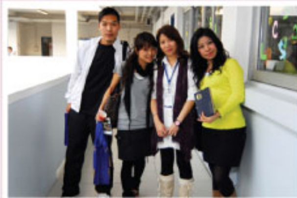
校友返回母校與老師合照