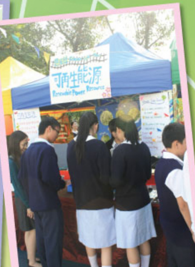
開放日恩光社攤位