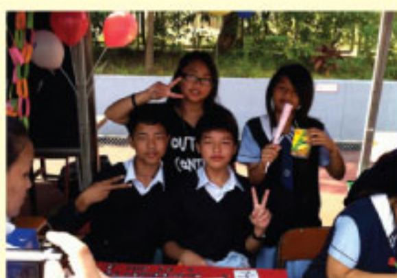
A Chinese game stall hosted by NCS students

開放日非華語學生盡展所長 Various activities on our 60th Anniversary Open Day