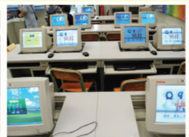
電腦科無紙辦公室