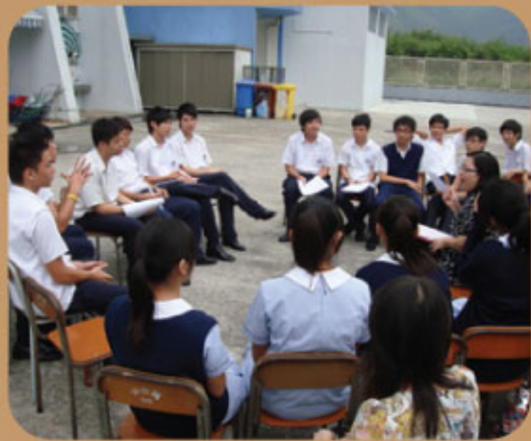
職業分享會中老師與學生 探討職業取向

升學及就業輔導組為加強學生與工作有關的學習經歷，拓闊學生的生活視野，並加強學生的人際網絡及社交溝通技巧，於10月15日為中四至中五學生舉辦了「良師益友」計劃 — 職業分享燒烤晚會。學生透過與良師益友的接觸，建立朋友或師兄弟姐妹關係，讓學生更清楚自己的就業取向，確定個人的就業目標。當天出席的學生除分享個人抱負，更從訪問已畢業的學兄學姊中，知悉某些工種的入職、薪酬、晉升等資料。此外，學生更學會出外謀生應有的工作態度，並獲得同校前輩的勉勵。