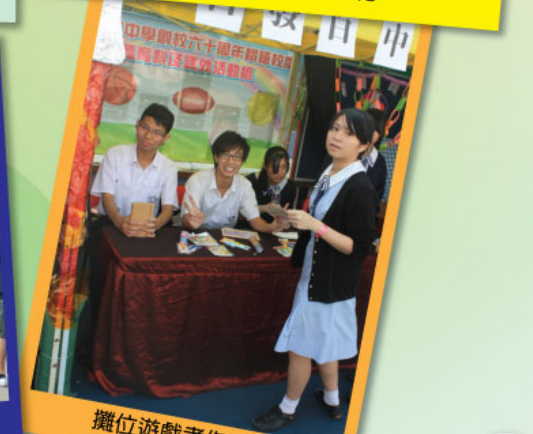
攤位遊戲考你眼界