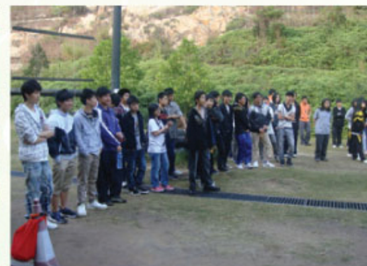
生活技能教育日營