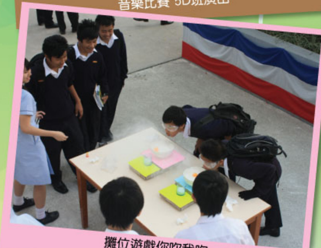
攤位遊戲你吹我吹