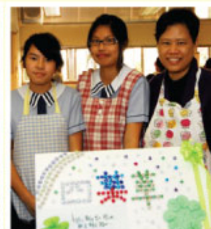
家政科展覽和試食及攤位