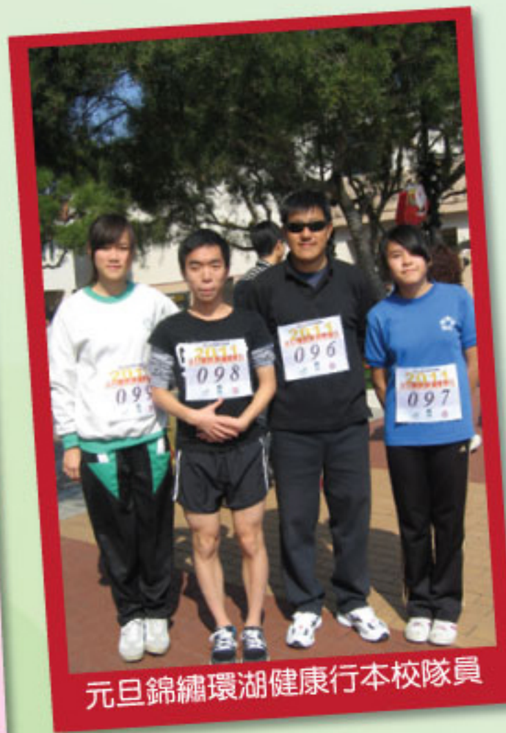
元旦錦繡環湖健康行本校隊員