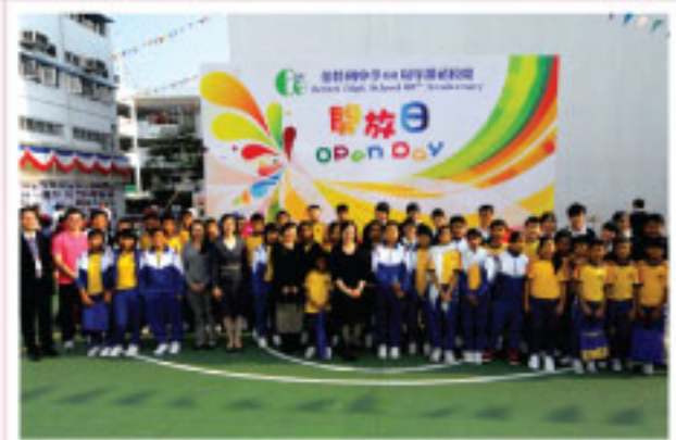
小六非華語學生參觀本校開放日

靜態的展覽和活動，亦能引人入勝，例如家政科「展覽和試食及攤位」、科學科「趣味的科學」、化學科「實驗示範」、物理科「消失星空的再現」、設計與工藝科「示範和展覽」、視覺藝術科「學生作品展」、圖書館「閱讀樂逍遙」、禮堂「茶聚和校園剪影及展覽」、教休室「校史館」等。凡參與一次攤位或參觀一次展覽均獲一個印章，參加者儲滿15個印章可換爆谷一份，儲滿20個印章可換棉花糖一枝。各項環節務求應有盡有，令來賓盡興而歸。