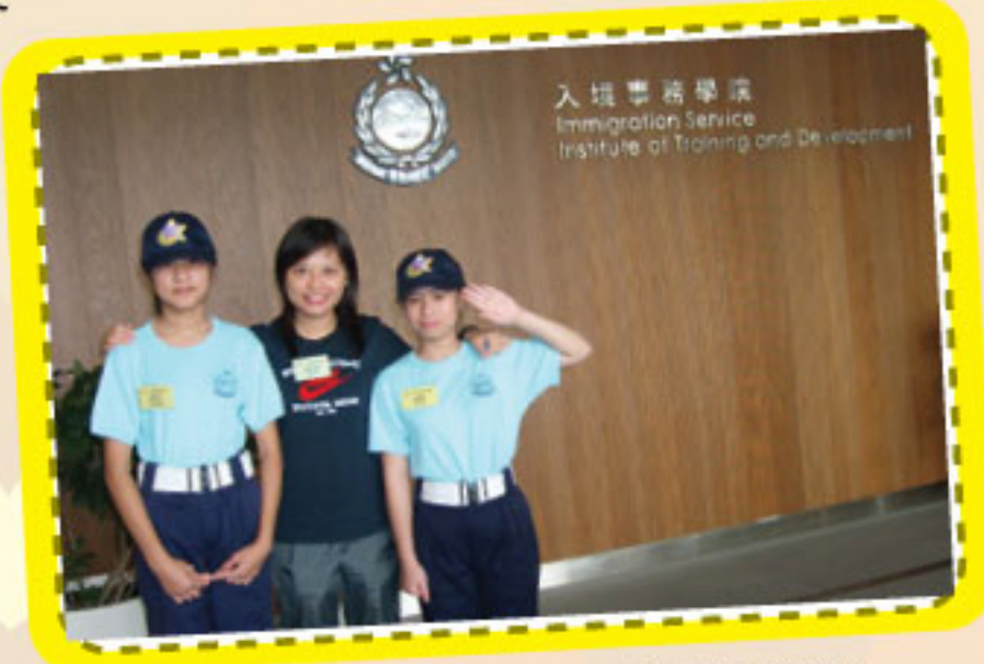
香港入境事務學院本校師生留影