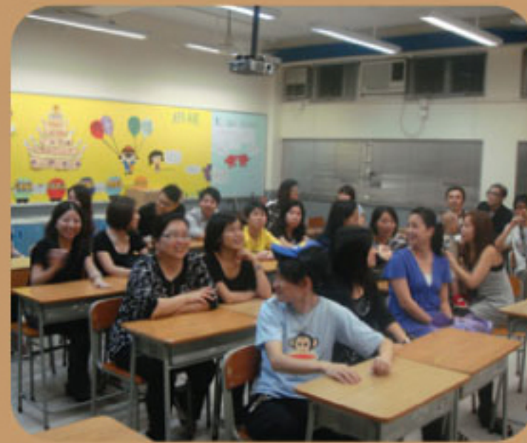
參觀校友興奮極了