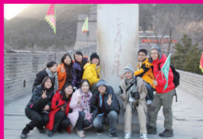
「不到長城非好漢」石碑留影