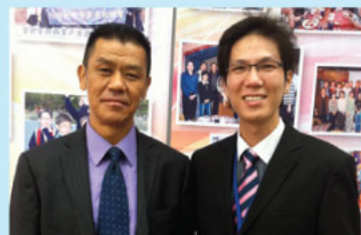
社群領袖蒞臨本校參觀非華語 學生教育工作 Community leader visiting the campus