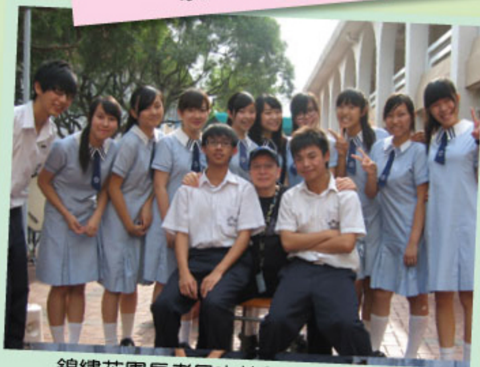
錦繡花園長者日本校學生與嘉賓合照