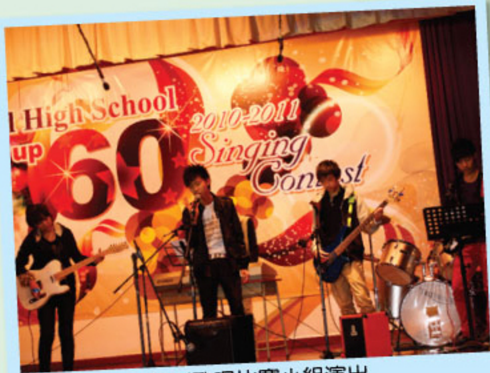
聖誕歌唱比賽小組演出