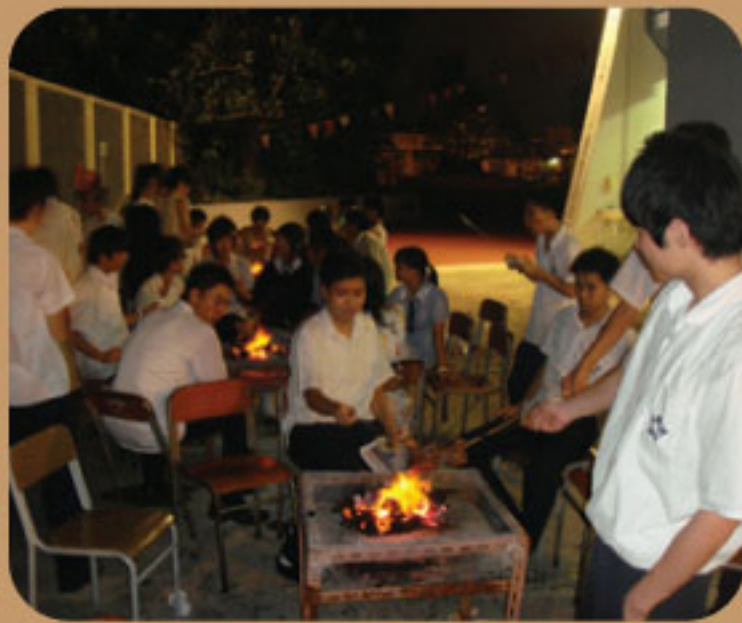
職業分享會燒烤活動