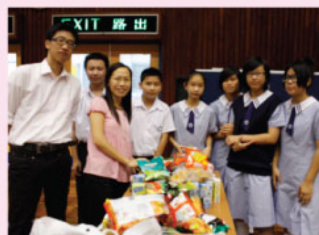
師生準備「朋輩關顧計劃」開幕典禮