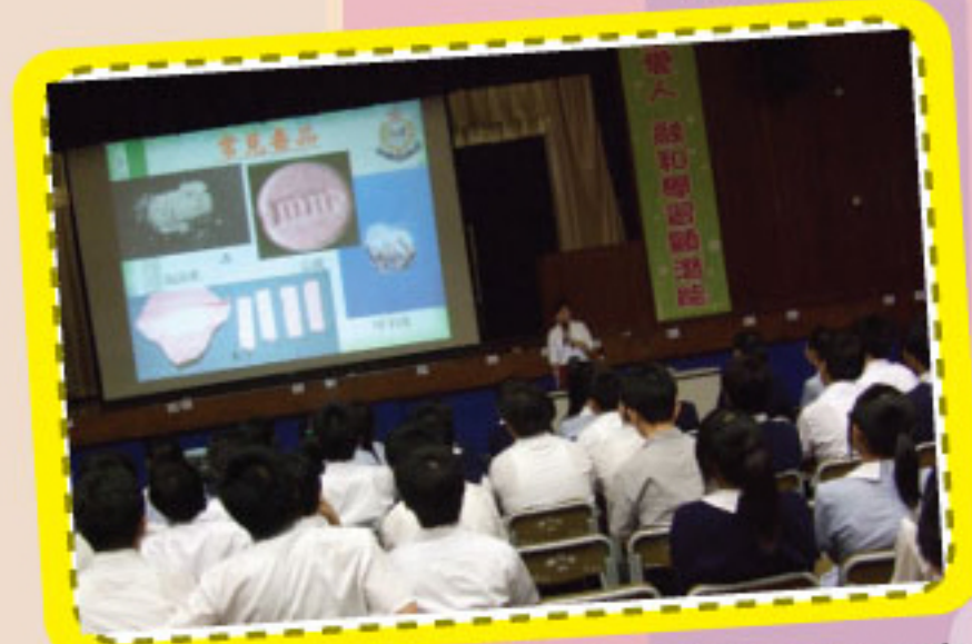
周警長主講「防範黑社會」學生周會講座