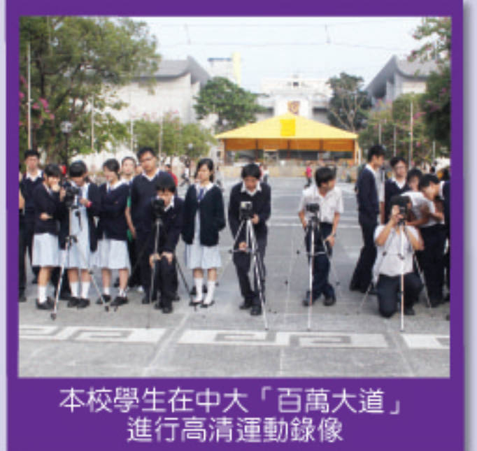
本校學生在中大「百萬大道」進行高清運動錄像