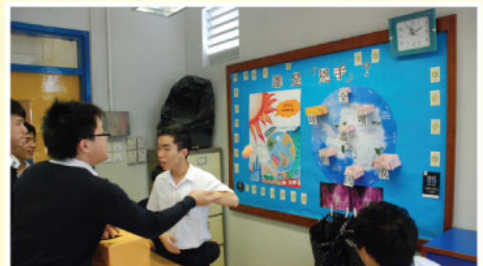
地理科及綜合人文科低碳生活