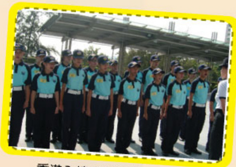
香港入境事務學院導師講話

領袖培訓方面，訓導組在12月份安排多位風紀學生參與學生發展組舉辦的領袖訓練營，透過與校外機構合辦的多項活動，加強學生的自信心、領導能力、技巧和團隊精神。充滿歡樂的領袖訓練營，無論對學生日後的學習、以至將來的工作均有所裨益。訓導組將於下學期安排野戰訓練和風紀領袖工作坊等，讓風紀學生有更多的機會體驗不同的經歷學習。