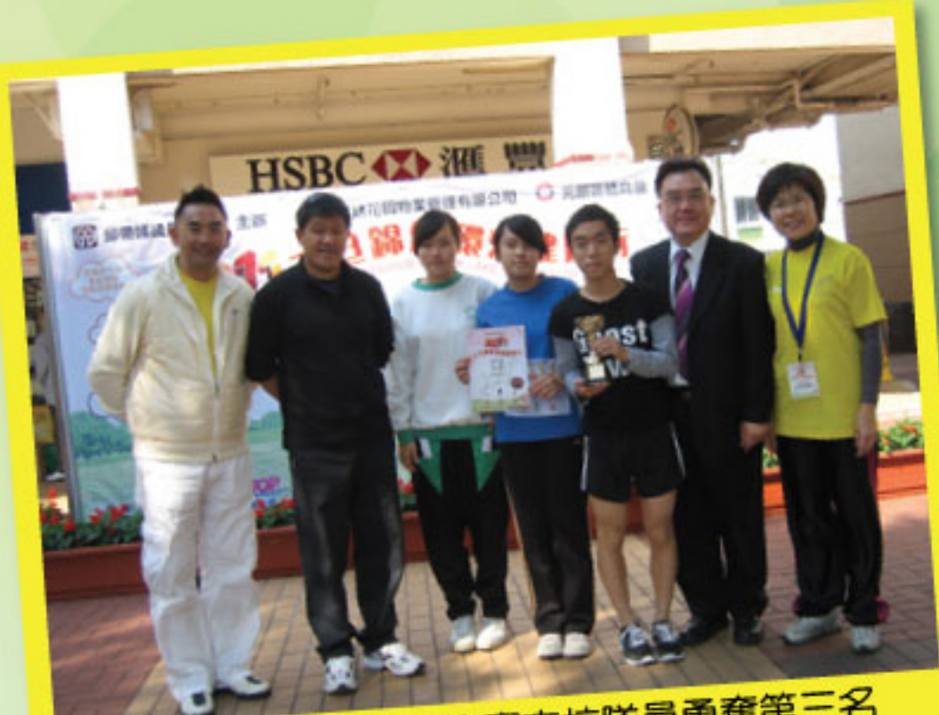
錦繡花園環湖接力比賽本校隊員勇奪第三名