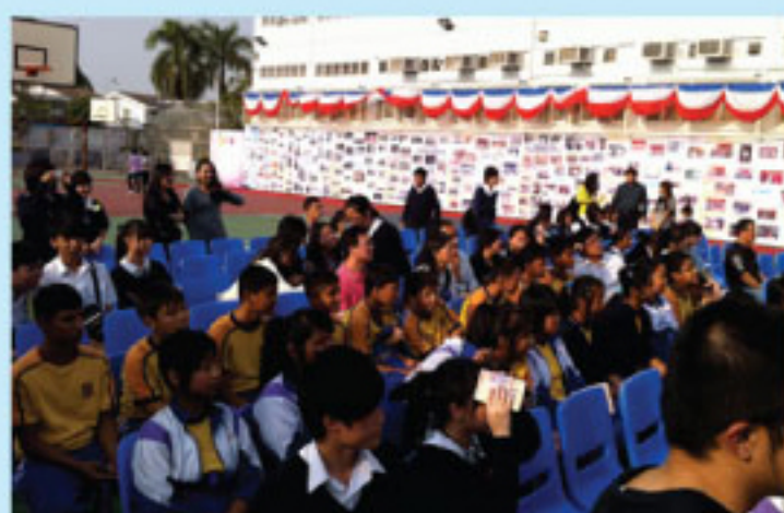
小六非華語學生升中觀校日 Primary school students visiting the campus