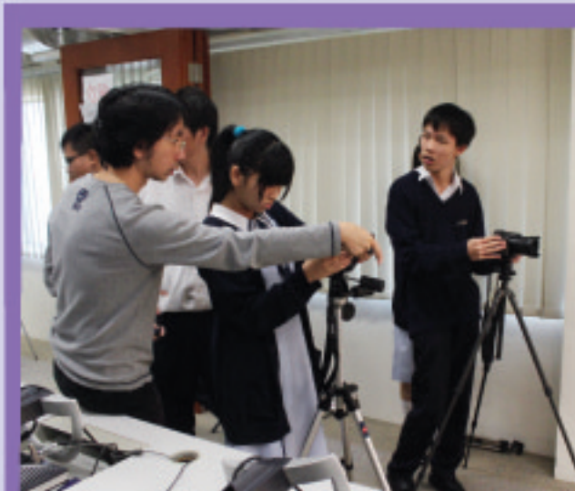
物理系導師指導學生進行高清運動錄像