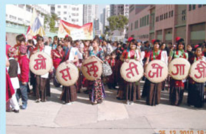
本校非華語學生參與元朗各社區 合作夥伴「少數民族文化活動」 NCS participating in the cultural activities in the community