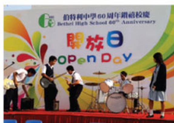
Rock music and Ethnic dancing performed by NCS students