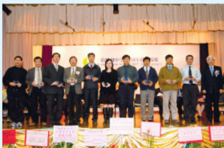
樓恩德牧師致送本校教職員 長期服務紀念品