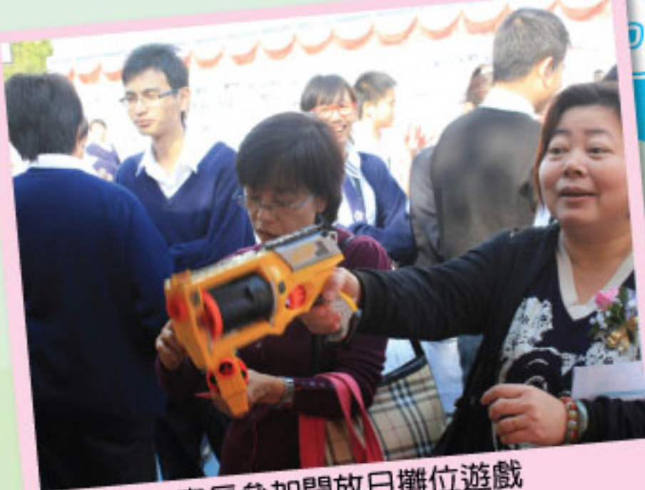
家長參加開放日攤位遊戲