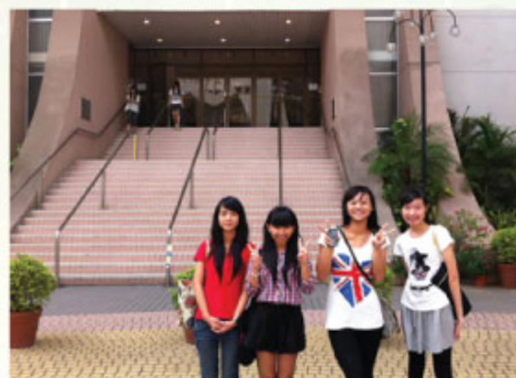
學生參加學友社「大學聯招講座」