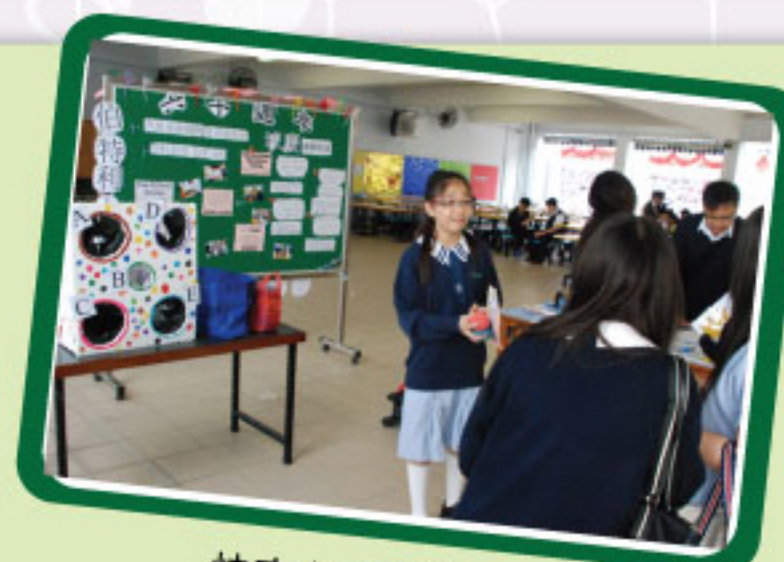
快來參加攤位遊戲

輔導組與社工於12月13日及14日合辦工作坊，讓學生善用午膳時間，學習製作快樂棒棒糖，寫上心意卡，送給親友，將快樂傳遞，表達心意。