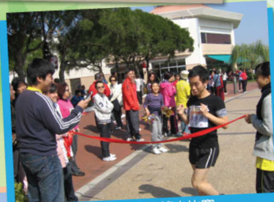
錦繡花園環湖接力比賽 本校隊員衝線