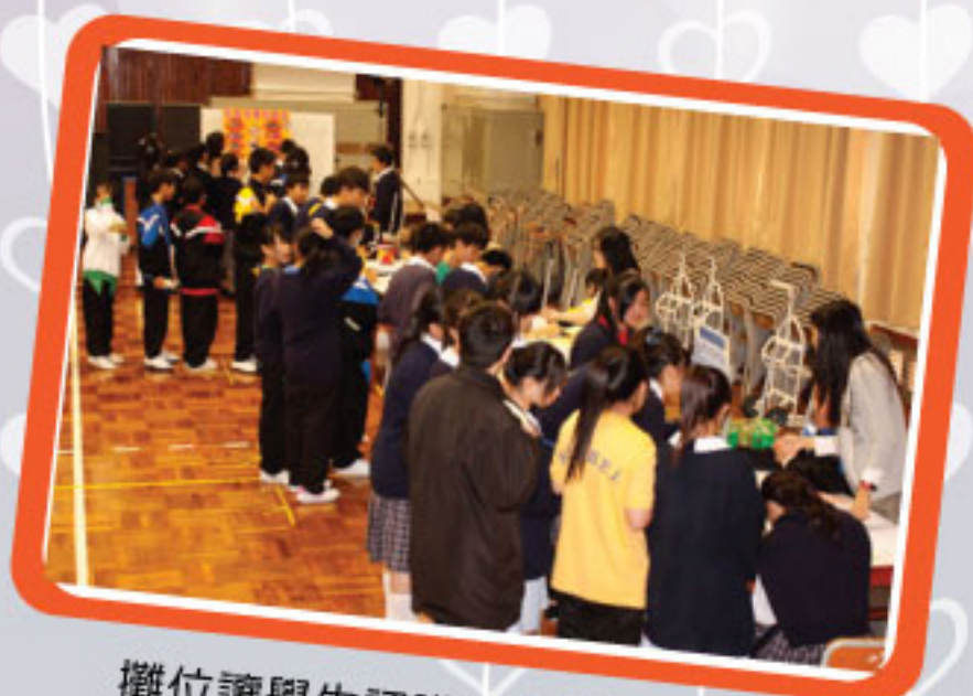
攤位讓學生認識有特殊教育需要人士的種類及需要

SEN學生支援組於12月21日與香港基督教服務處學校社會工作服務機構合作，為中二級學生舉辦「共融嘉年華」，透過互動遊戲及講解，讓學生明白有特殊教育需要人士的種類及需要，培養學生尊重他人，建立全校參與的融合教育文化。