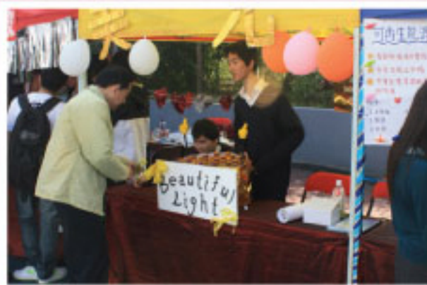
開放日美光社攤位