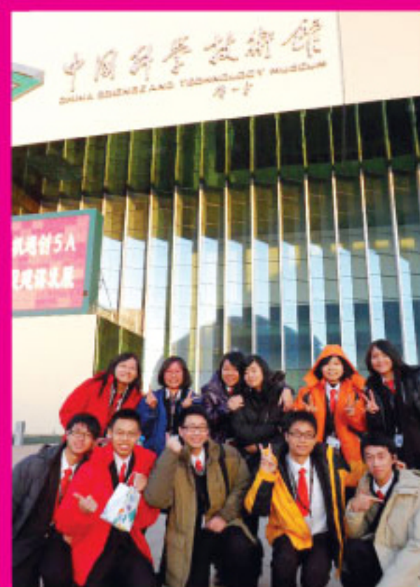
參觀中國科學技術館

十天的活動內容充實，讓我們對中國現今的外交、政治、經濟等各個領域有更深入的了解。雖然中國已名列世界強國，中華兒女仍需努力，掃除社會的隱疾，貢獻國家。我們一起前進！」