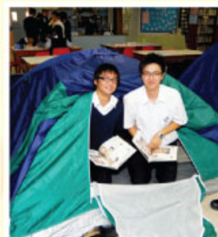
圖書館閱讀樂逍遙