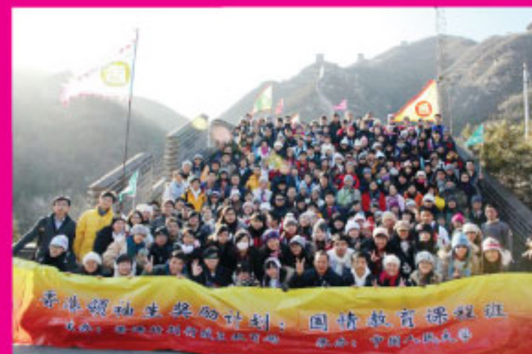
「國情教育課程班」學生大合照