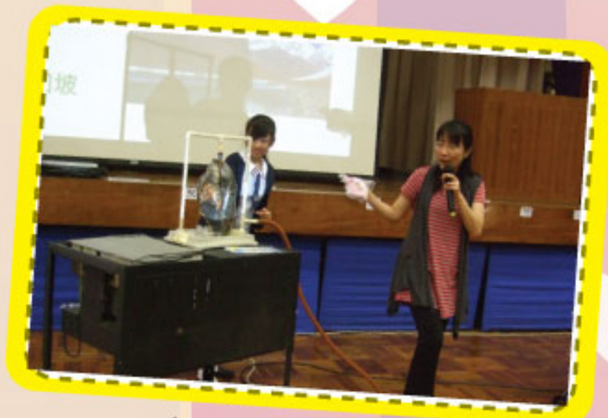
中二級學生周會講座 「青少年吸煙和吸毒」

發展性活動方面，訓導組除邀請校外機構如社工和警方代表到校，為學生舉行生命教育講座外，也舉辦班際勤到守時比賽及個人勤到守規比賽，鼓勵學生注意勤到守規的重要。據上學期的統計顯示，不少學生獲得勤到守規獎，活動已達到應有的效果。訓導組將繼續舉辦多項活動，鼓勵其他未有參與以上活動或獲獎的學生，能以此為目標，在下學期努力邁進，成為品學兼優、具有領導能力的學生。