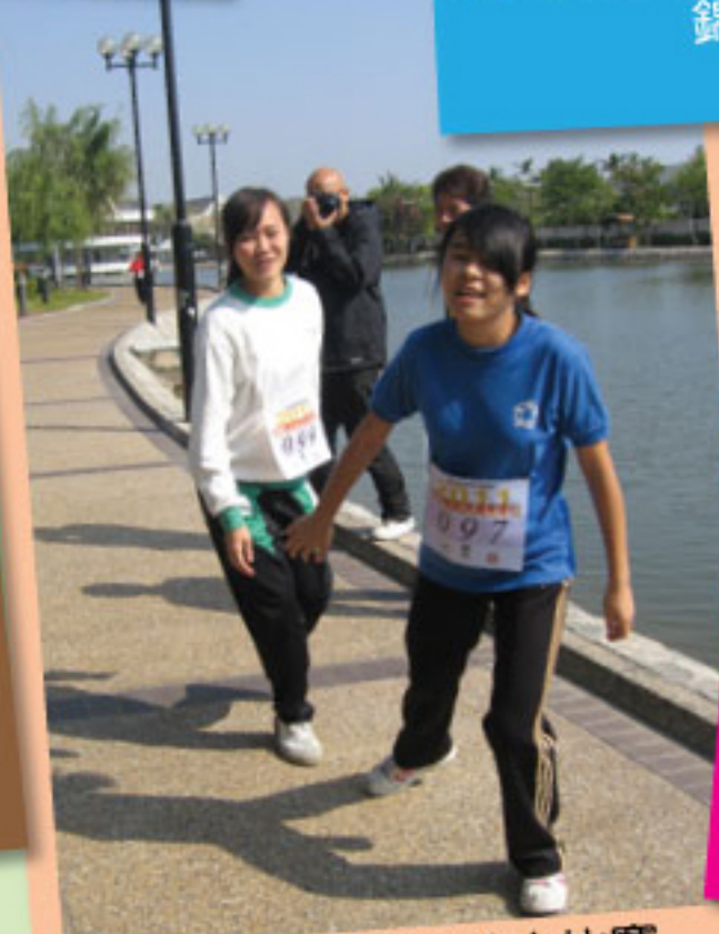
錦繡花園環湖接力比賽