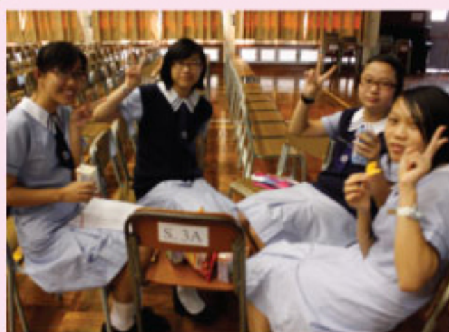
學長與學弟妹建立朋輩關係