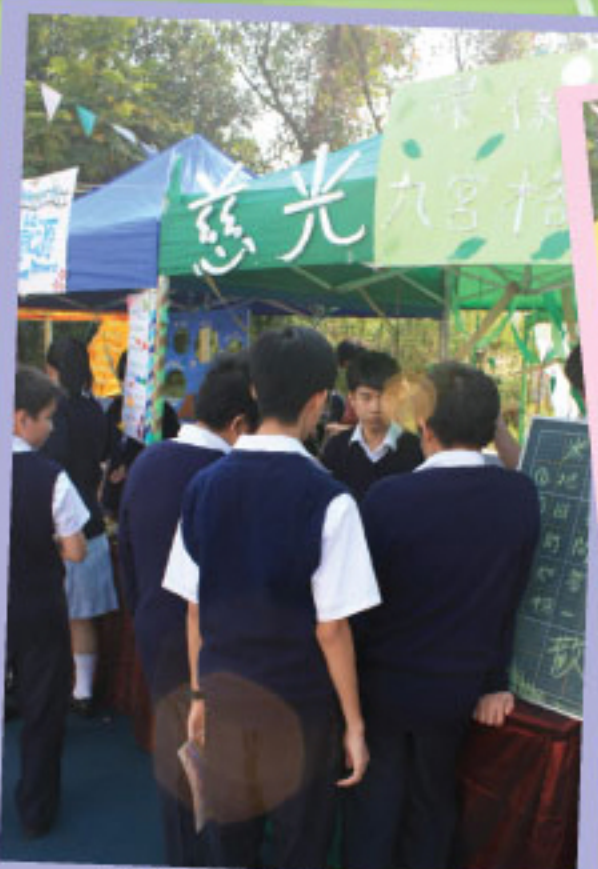
開放日慈光社攤位