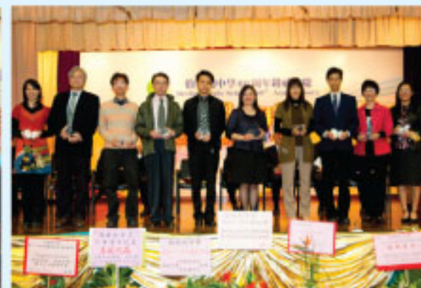
余羅少文女士致送本校教職員 長期服務紀念品