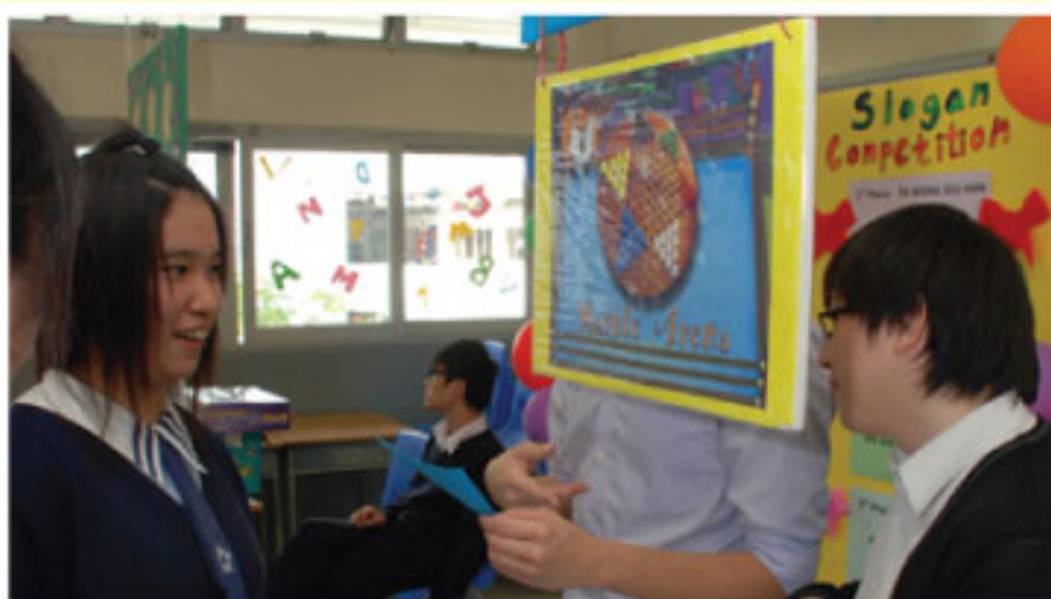
英文科 environmental protection

感謝天父的帶領，一連兩天的開放日在校友的故地重遊，嘉賓的應邀蒞臨，家長的歡天喜地和學生的愉快學習，終於圓滿結束。開放日讓學生體會辛勤工作才有可貴的成果，也明白團隊協作的重要，拉近了師生的距離。