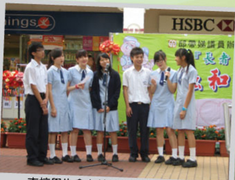
本校學生會在錦繡花園長者日獻唱