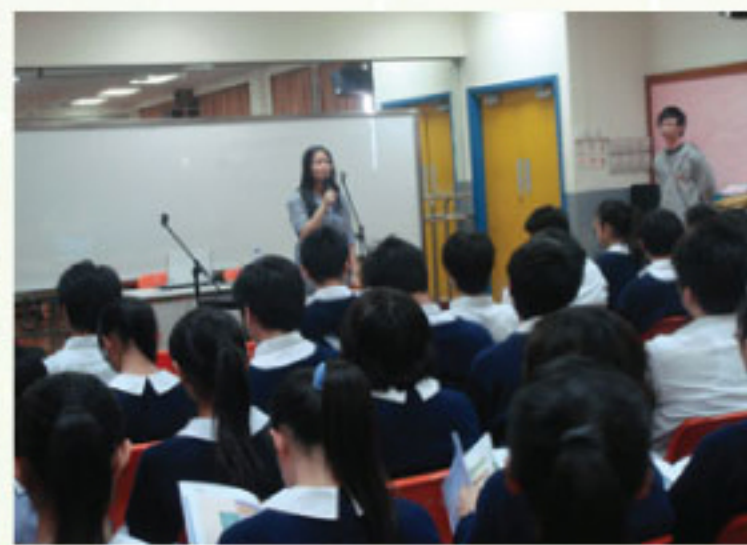
香港大學附屬學院副學士課程講座