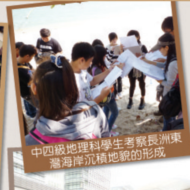
中四級地理科學生考察長洲東灣海岸沉積地貌的形成