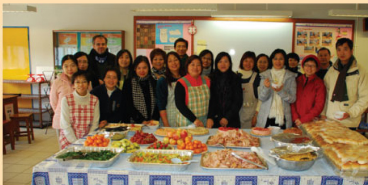
家教會家長在12月21日午膳時設宴與全校師生分享美食