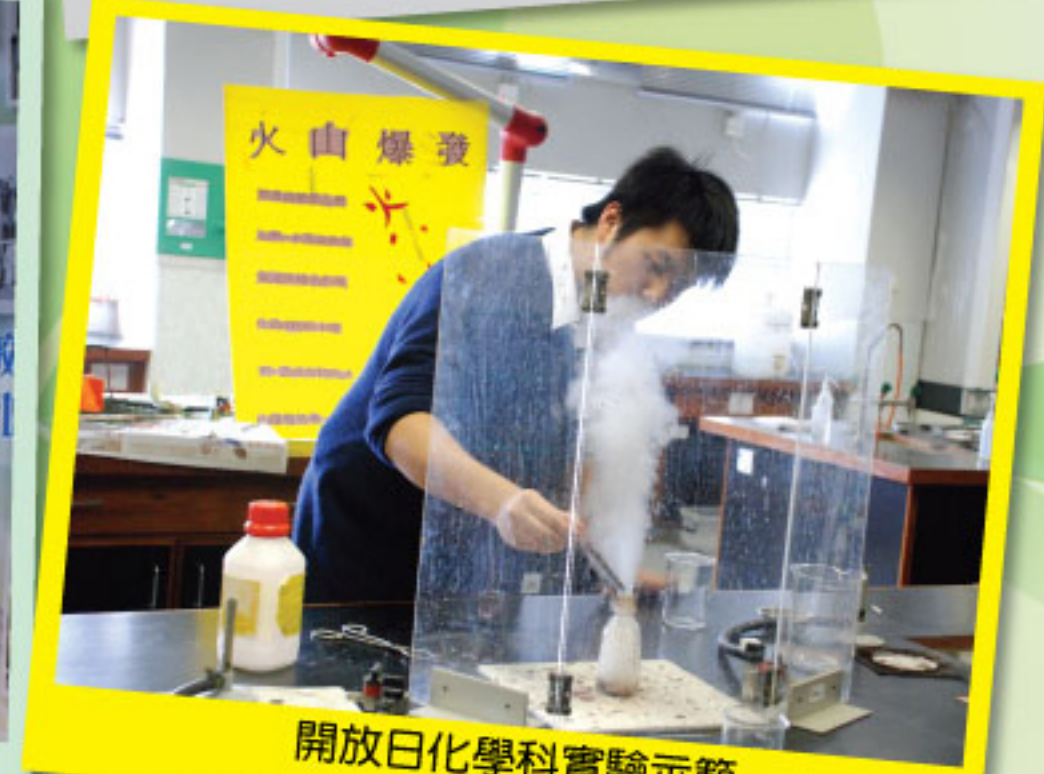
開放日化學科實驗示範