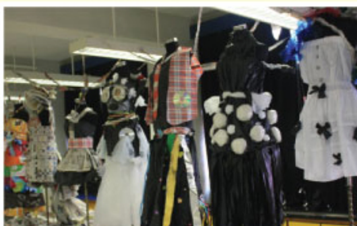
環保服裝設計比賽優勝作品