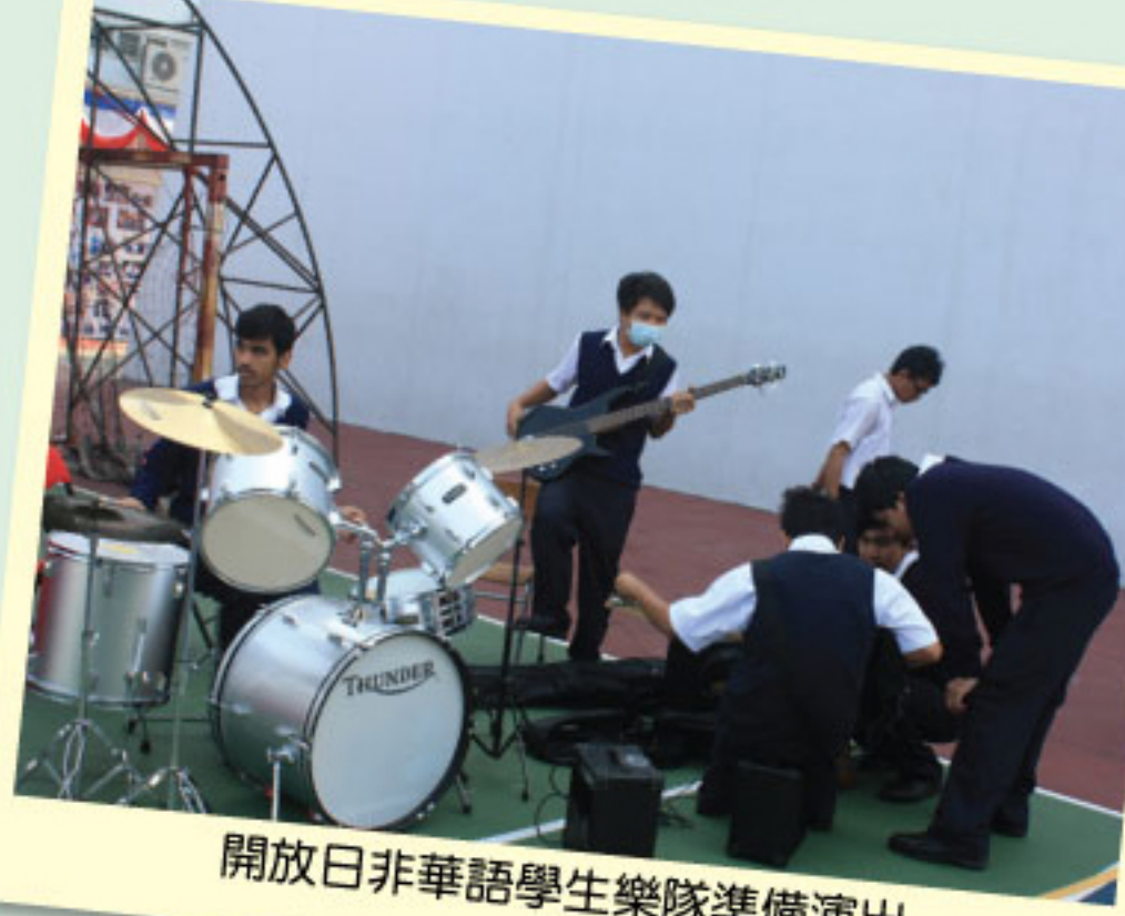
開放日非華語學生樂隊準備演出