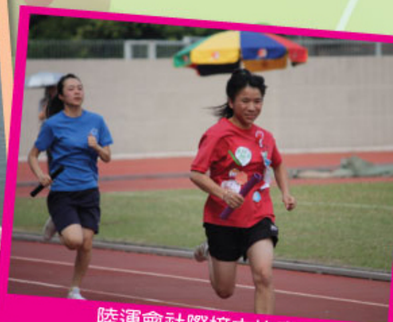
陸運會社際接力比賽