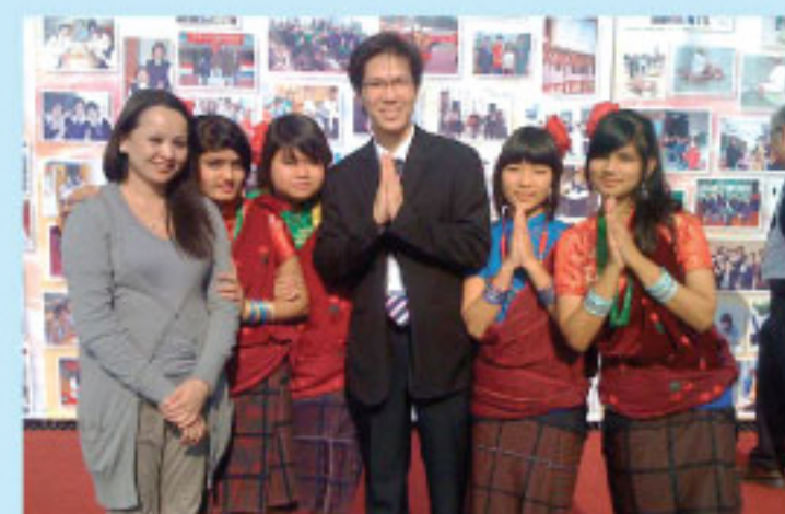
尼泊爾教學助理訓練學生 民族文化素養 The Nepali teaching assistant being the dance trainer