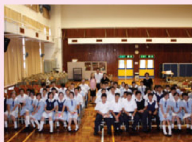
「朋輩關顧計劃」開幕典禮