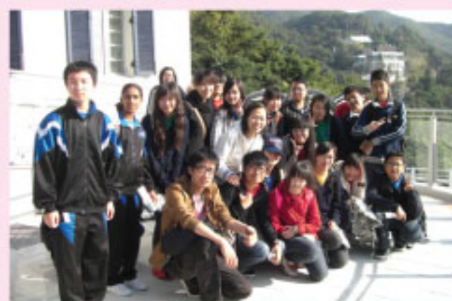
參觀香港警隊博物館

活力組舉辦「朋輩關顧計劃」，增強高低年級學生的交流，讓新來港學童更容易適應校園及本港的生活，增加學生對學校的歸屬感。於上學期，本組舉辦粵語增潤課程，提升他們的粵語說話能力；於聖誕節舉辦學習活動暨「朋輩關顧計劃」聯誼活動，學長帶領學弟妹暢遊大潭水塘家樂徑、警隊博物館，從中認識香港的地理環境及歷史，也藉此讓高低年級的學生交流聯誼，讓學弟妹盡快適應本港的學習及生活。