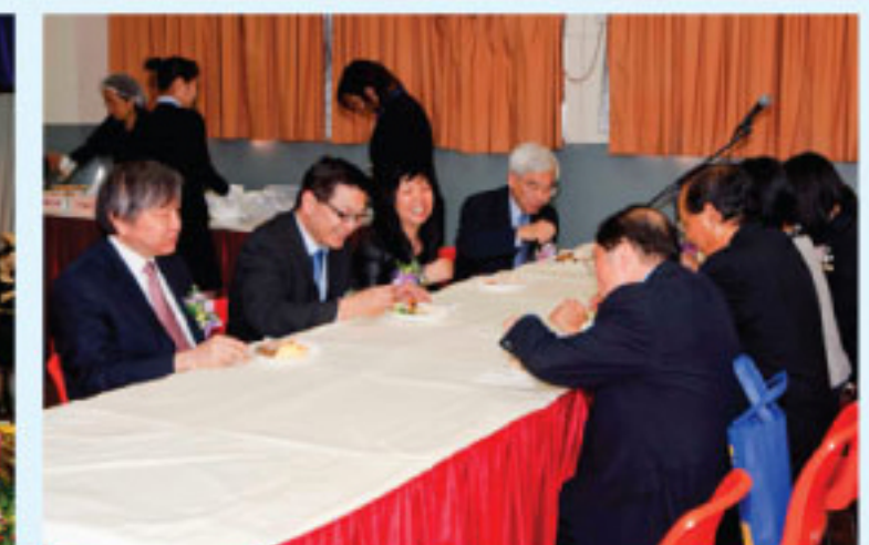
崇拜後設宴款待來賓