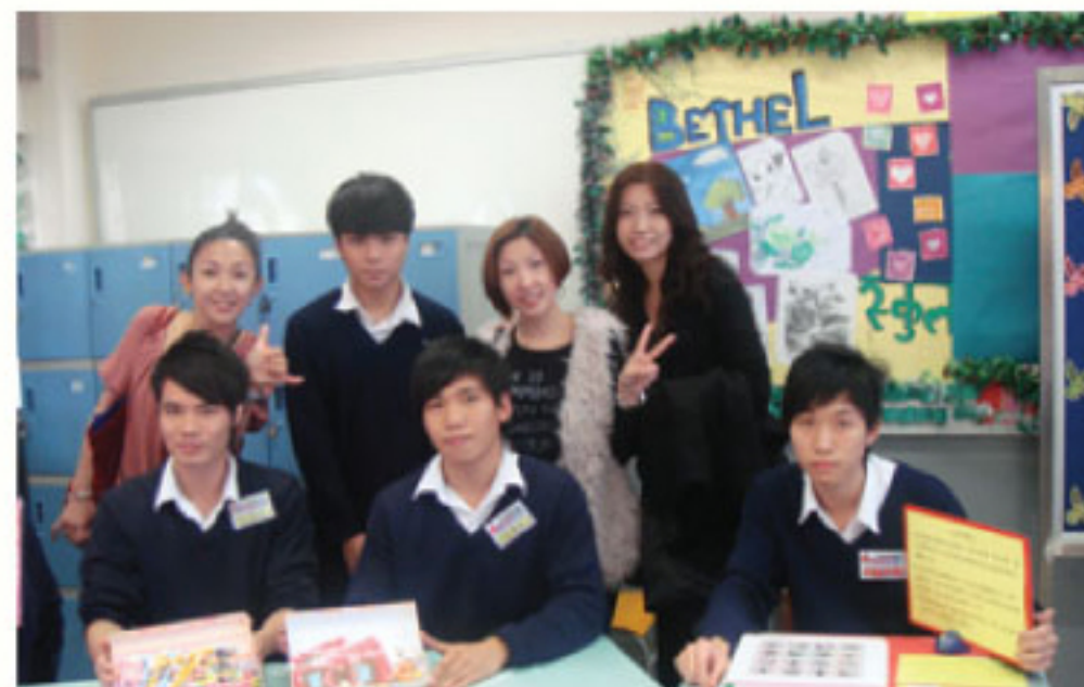
開放日校友與工作人員合照