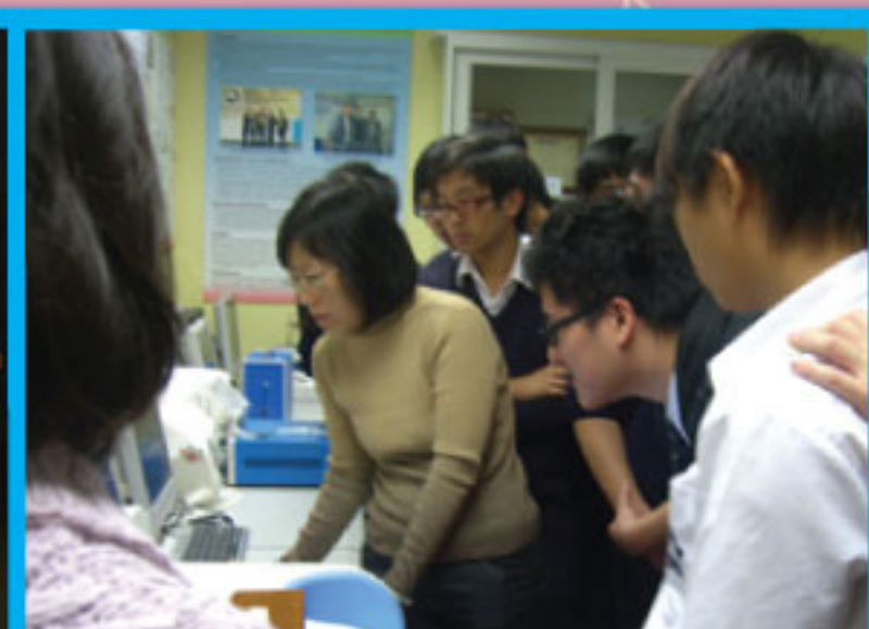
學生對「舌頭健康識別」儀器的使用示範，很有興趣