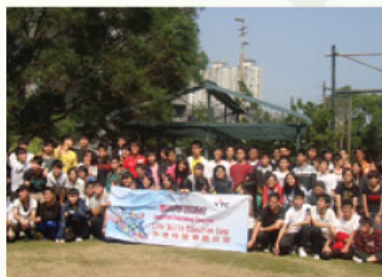
生活技能教育日營大合照