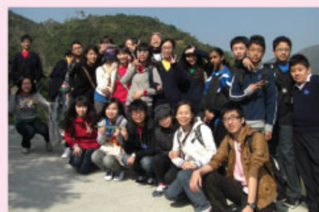
大潭水塘家樂徑聖誕聯誼及學習活動