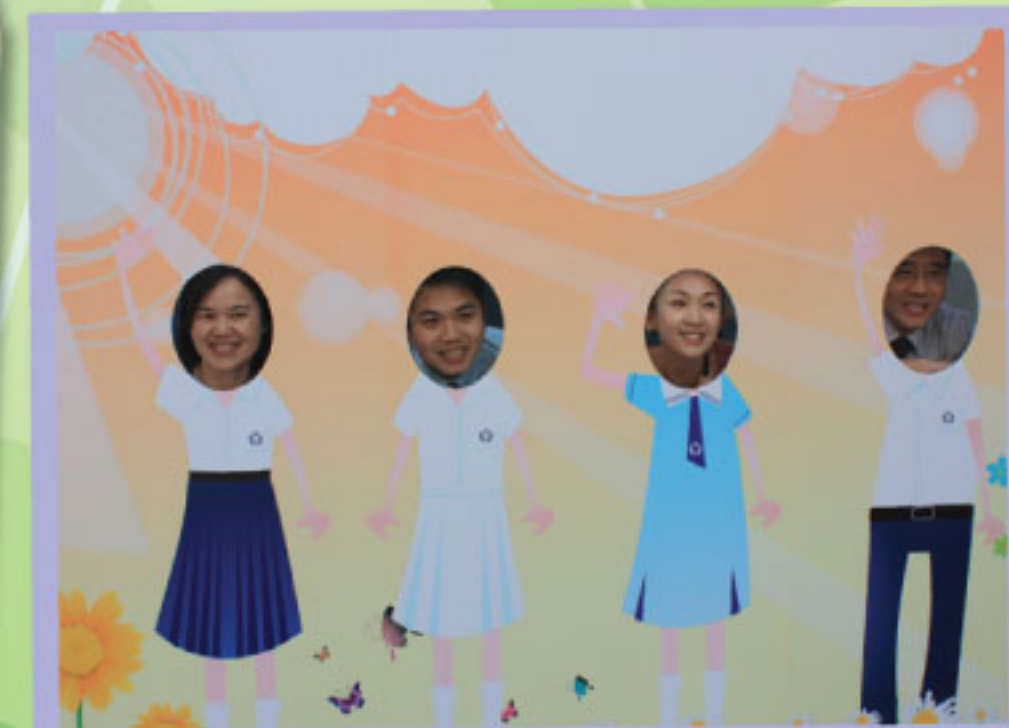
開放日校長與老師回復童真