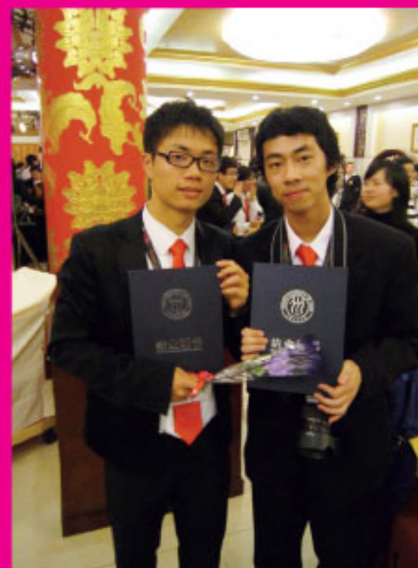
「國情教育課程」結業證書