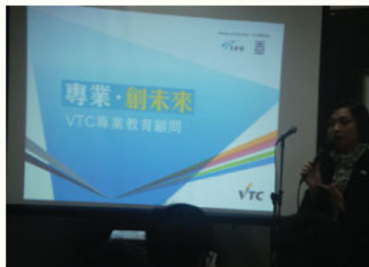
香港專業教育學院講座

升學及就業輔導組提供學生參與校內外活動的機會，舉辦與職業有關的講座、參觀、工作坊和班主任課等活動，豐富學生與工作有關的學習經驗，提升學生的自信心，並照顧不同學習需要的學生，提供多元化的選修課程及輔導工作，讓不同能力的學生能夠發揮潛能。