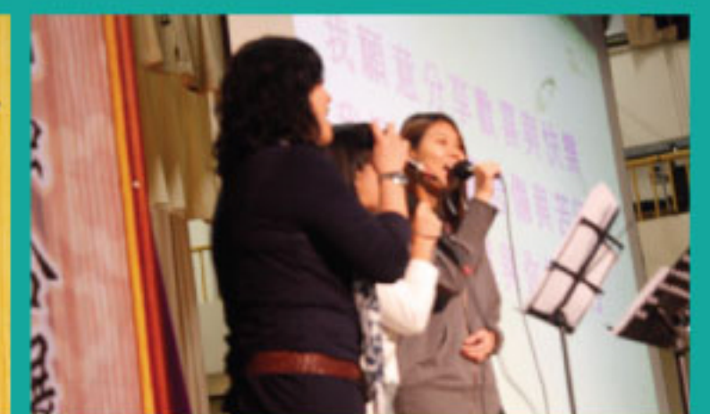
「音樂二千」在高中級信仰講座主領聚會