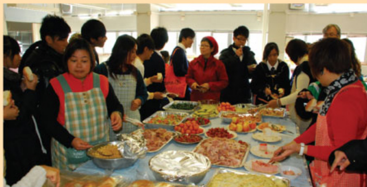
學生一起分享食物