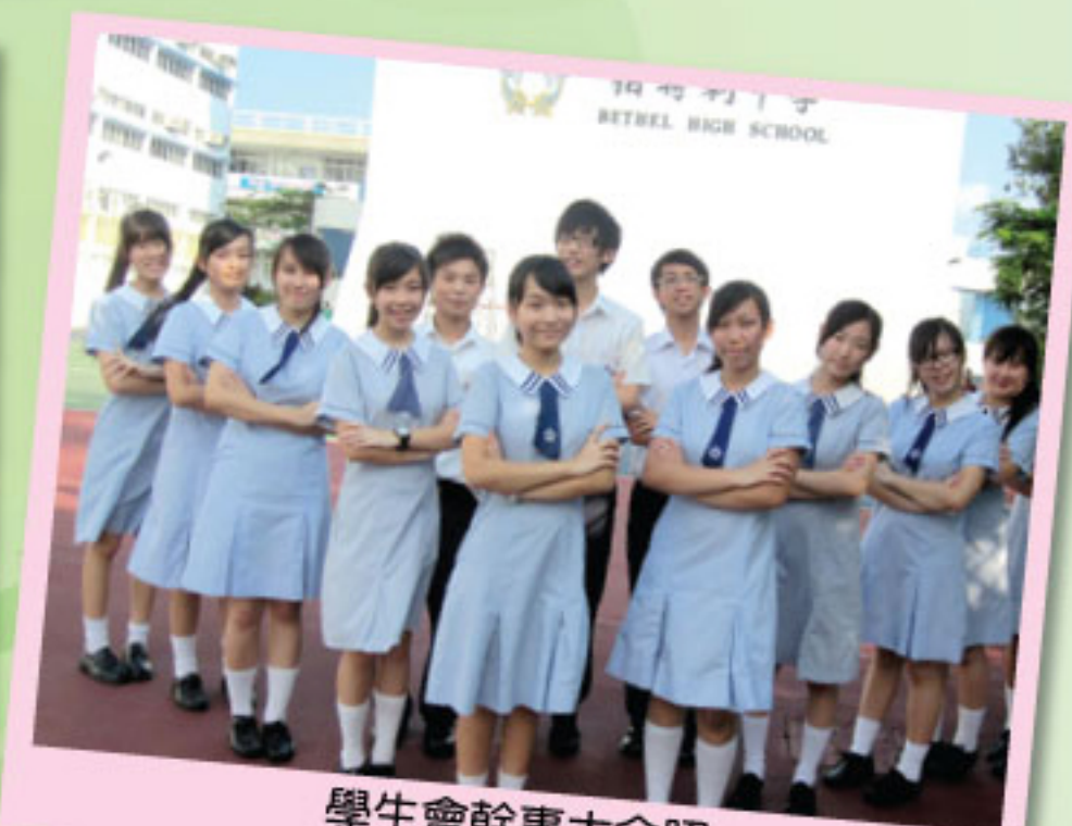
學生會幹事大合照