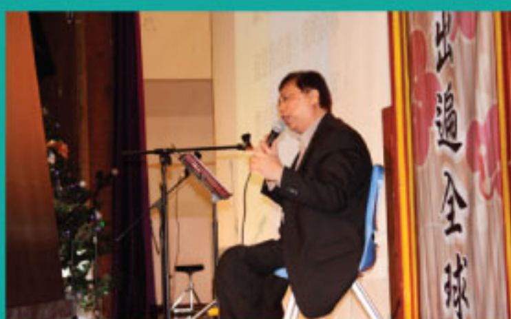
聖誕崇拜邀請基督教伯特利會弟兄獻詩