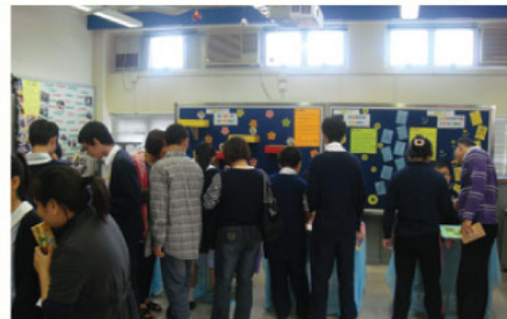
開放日嘉賓與學生參與升輔組活動