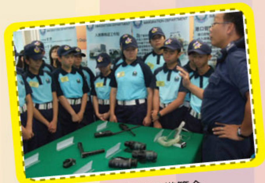
入境事務處設備簡介