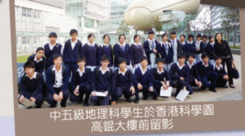
中五級地理科學生於香港科學園高銳大樓前留影