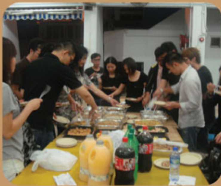
眾多校友樂也融融