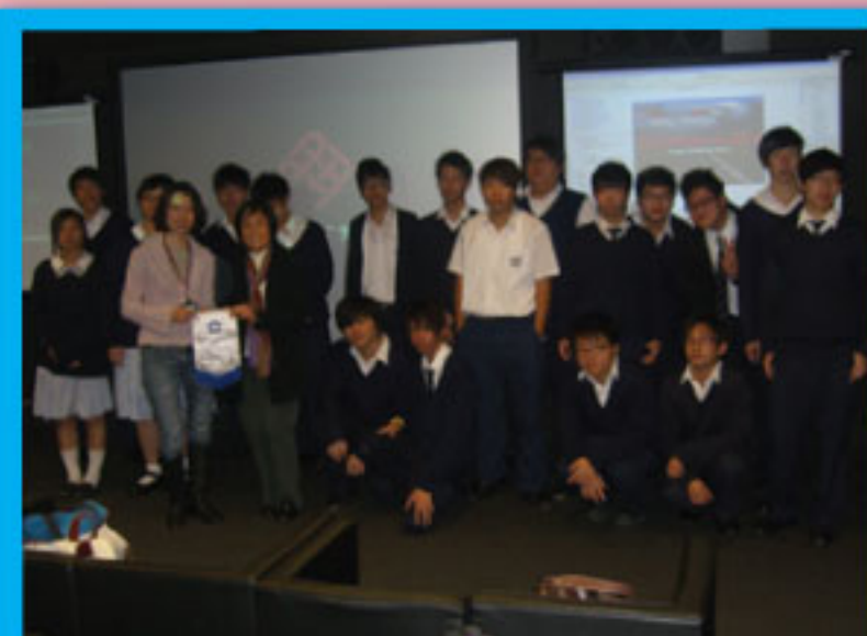
參觀「多媒體劇院」後合照