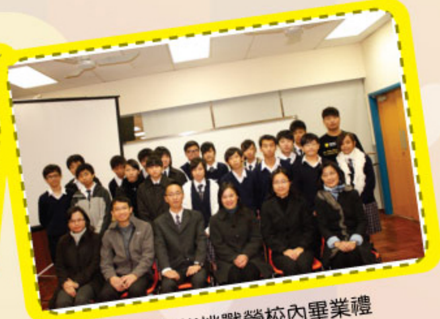
多元智能挑戰營校內畢業禮