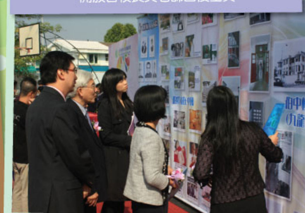
吳校長向嘉賓介紹長廊