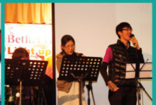
聖誕崇拜邀請基督教伯特利會遵理堂弟兄姊妹領會