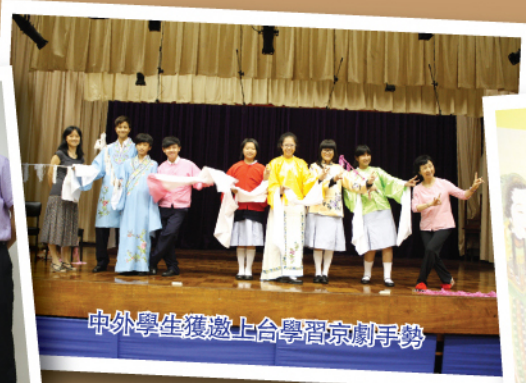
中外學生獲邀上台學習京劇手勢