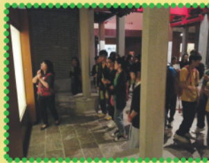
同學留心聆聽導賞員的講解