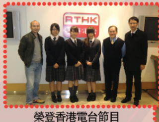
榮登香港電台節目