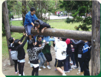
全組互助跨過木柱，驚險萬分