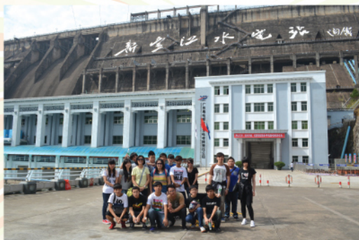
參觀新豐江水庫大壩

這是我第一次參與考察活動，在這三日兩夜的行程中，我們參觀了不少的景點，也到過很多具歷史價值的地方。這次考察除了解客家人的文化，風俗習慣外，亦增進同學之間的友誼，更令我學懂怎樣照顧自己。