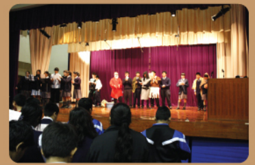
全體師生壓軸合唱樂哉斯世