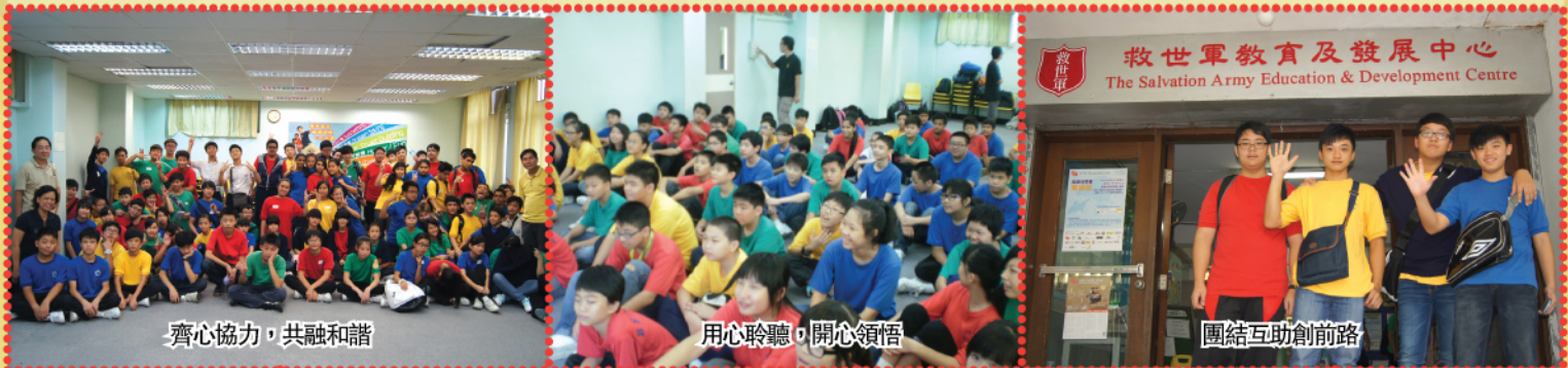
齊心協力，共融和諧

參加者表示活動有苦有樂，但導師用心教導學員如何度過難關，令組員發揮團隊合作精神，超越自己的能力。可惜活動時間太短，希望將來有機會能再參加此類活動，學習更多解難技巧。