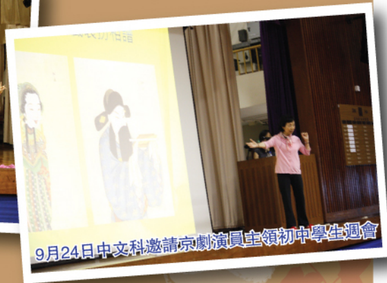
9月24日中文科邀請京劇演員主領初中學生週會