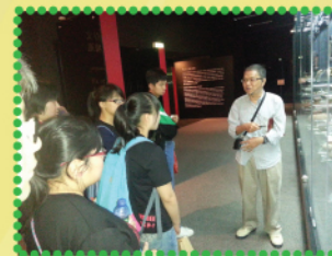
同學在文物探知館聆聽導賞員講解