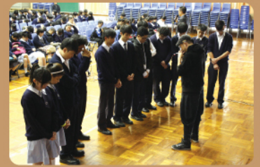
高中佈道會領會者呼召學生上前禱告