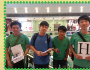
同學擔當工作人員