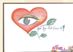
季軍 3B Limbu Pramisha