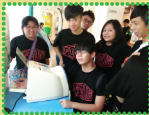
在衛生教育展覽及資料中心測試血壓