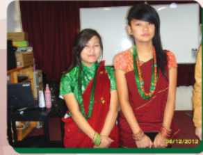
同學穿上尼泊爾民族服裝