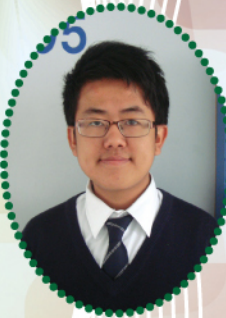
2B LIMBU DIKEN