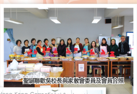
聖誕聯歡吳校長與家教會委員及會員合照