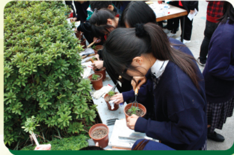
同學們用心移植小花苗