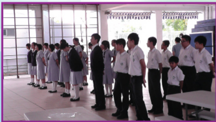
中一特色課程-升旗隊步操訓練第一課

為了照顧學生的整體發展，我們邀請校外機構和警方代表，到校舉辦一些有助學生建立人生觀的講座，例如認識正面價值觀、如何慎交朋友、防止吸煙、防止濫用藥物以及推廣警察招募等講題，以助學生避免行為偏差，積極面對人生。11月份，我們藉著wargame活動，讓不同學生認識賭博的禍害，向賭博說「不」。在班際勤到守時比賽及個人勤到守規比賽方面，我們增加統計的頻次，以勉勵更多同學自律守規，並衷心盼望同學們在下學期繼續努力，更進一步。