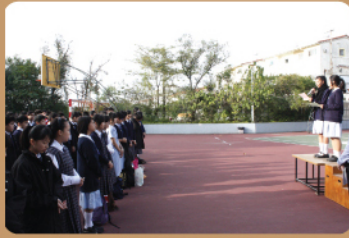
學生在集會時宣傳福音週