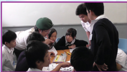
中一特色課程-童軍活動