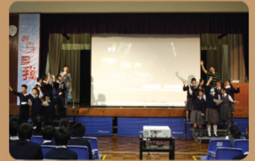
初中佈道會福音幹事與學生一起唱聖詩