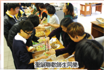
聖誕聯歡師生同樂