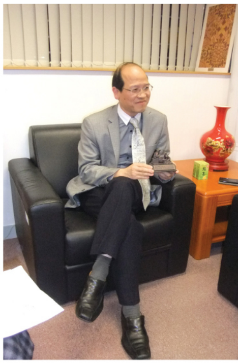
鄭校長展示「僕人領袖」小模型

鄭校長領受到上帝早已為他預備基督教崇真中學，無論是開辦教會工作，或是堂校合作，他都樂於事奉。他大力推動學校的靈育發展，包括政策及資源上的配合。為了讓更多學生認識並信靠上帝，他一面聘用教學助理專職靈育工作，一面親自向學生分享屬靈的經驗。鄭校長在自己的辦公桌上放置「僕人領袖」小模型，經常提醒自己要擔當「僕人領袖」。面對繁重的學校工作，他笑言只要以心待人，多與人溝通，願意聽取別人的意見，又讓別人了解自己的想法，什麼問題都能迎刃而解。