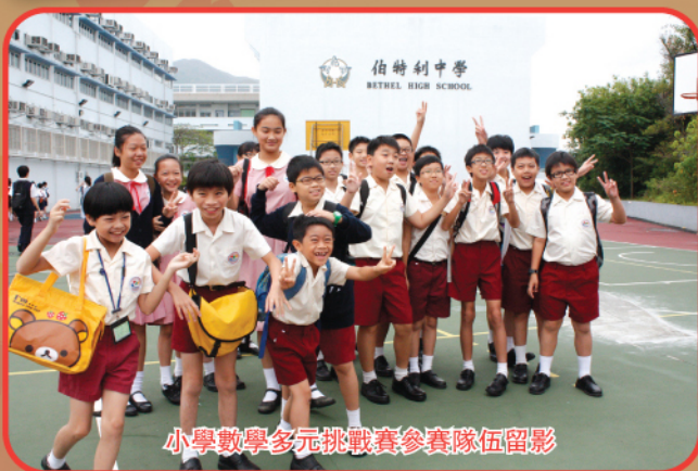
小學數學多元挑戰賽參賽隊伍留影