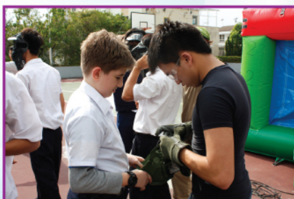
為參加防止賭博wargame做好準備