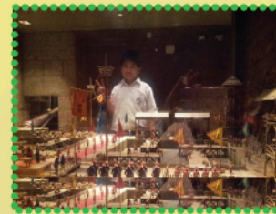
同學被精緻的模型吸引