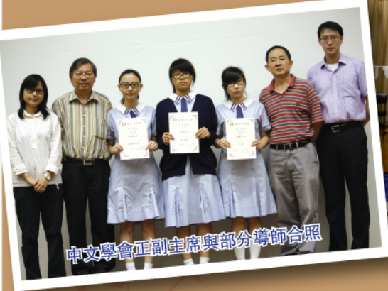
中文學會正副主席與部分導師合照