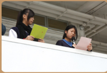
學生在早會宣傳福音週