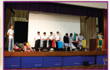
同學積極參與學生講座