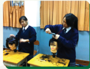
認真學習理髮技巧