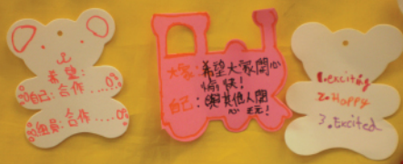
互相祝福，愉快人生