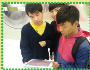
iPad內亦有多種不同類型的數學遊戲

中國語文科帶領同學前往香港文化博物館參觀，重點認識粵劇文化。透過導賞員的講解，同學對粵劇文化有了進一步的認識。