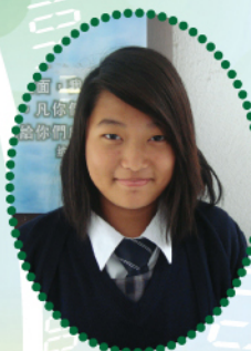
3B GURUNG YOJANA