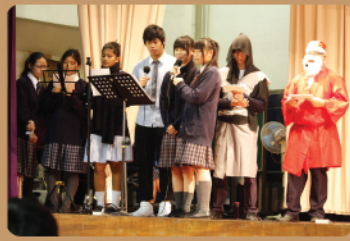
本地學生與非華語學生一起領唱聖誕歌