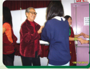
同學與長者共跳民族舞