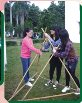
協力建築竹炮台，準備發射