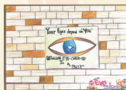
亞軍 3B Ghondey Ashmi