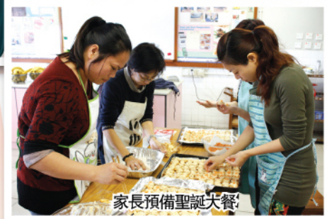
家長預備聖誕大餐