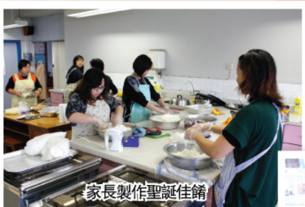
家長製作聖誕佳餚

本會在下學期將會繼續舉行不同類型的活動，期望家長踴躍參加，一起投入家教會活動，家長與老師共同合作，努力創造更美好的伯特利中學。