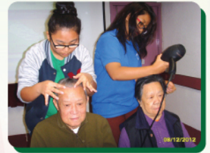
同學細心為長者理髮