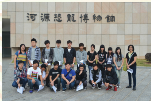
參觀河源恐龍博物館