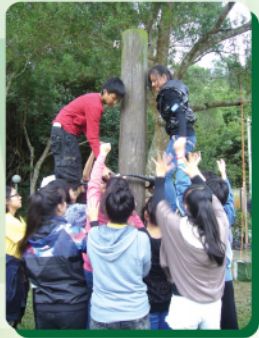
克服心理難關，勇敢面對挑戰

為培養初中同學的領袖才能，本校於聯課活動時舉辦未來接班人計畫，由老師推薦20位有領導潛能的中二及中三級同學，參加11月30日至12月2日舉辦之領袖訓練營。學校希望透過領袖培訓的課程及營會活動，培養同學們的領袖素質，期望他們將來能成為學生領袖的接班人。