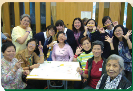
同學與長者樂也融融

4B班同學已於10月22日及29日在聖經科課堂內，由黃錦輝社區中心社工帶領進行義工服務前培訓，並於11月15日到宣道會錦繡堂黃錦輝社區中心服務博愛醫院王東源夫人長者，同學為長者獻唱懷舊金曲，並與長者一同玩遊戲，長者則教同學織手繩。同學從中學習如何帶領活動，更體會如何接納及關懷長者。