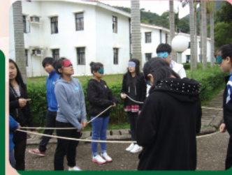
蒙上眼睛，也難不倒同學合作完成任務