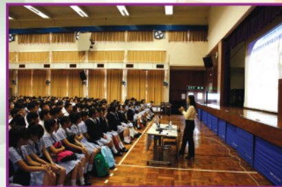
李警長分享防止受毒品引誘的方法