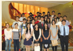
參觀外交部專員公署