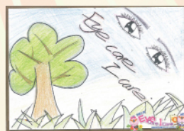
亞軍 2A 蔣雪兒