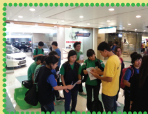
同學努力完成遊戲