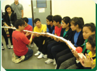
齊心運送彩球，發揮合作精神