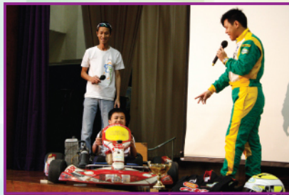
人生方程式現身說法講座