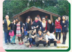
開心暢遊挪亞方舟