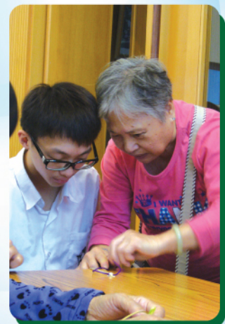
長者教同學編織手繩