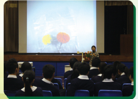
邀請專業花農為學生講解種植萬壽菊的竅門