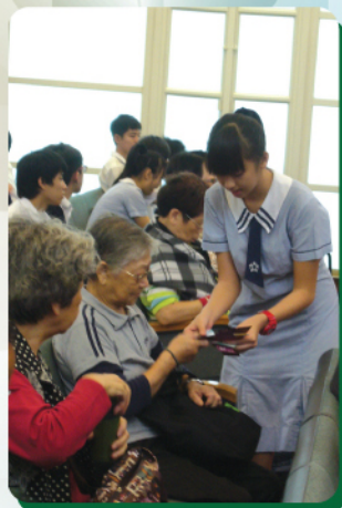
向長者獻上自製心意卡