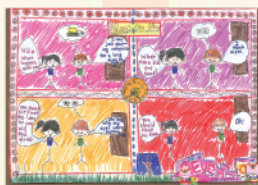
冠軍 2B Pun Monica