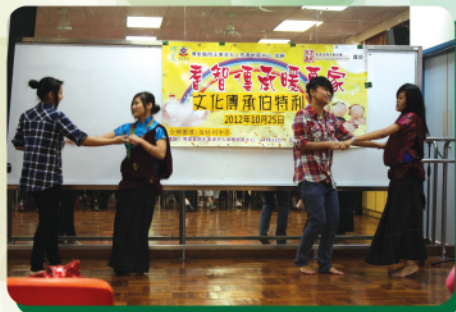
同學為長者表演尼泊爾民族舞