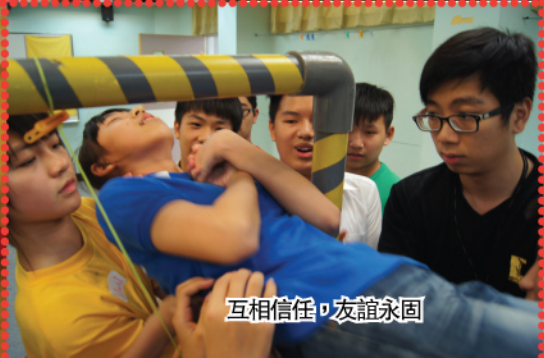
互相信任，友誼永固