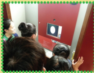
同學在文物探知館聆聽導賞員講解