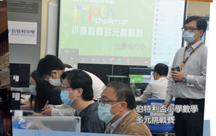
伯特利小學數學多元挑戰賽