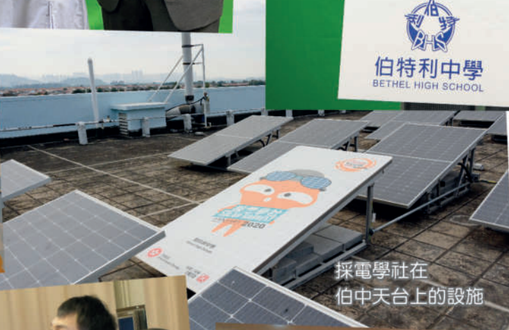
採電學社在 伯中天台上的設施