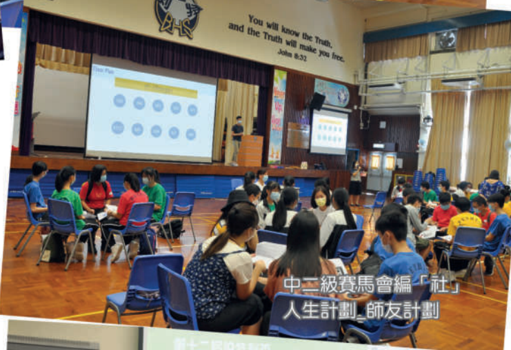
中二級賽馬會編「社」人生計劃 師友計劃