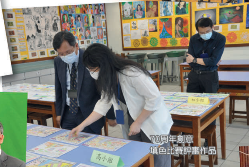
70周年創意 填色比賽評審作品