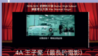
4A 王子豪 (最長的電影)

一年一度的全校歌唱比賽於2020年12月22日順利完成。是次比賽由6A班劉雪櫻、1C班Gurung Pratiskshya和4A班王子豪同學分別奪得冠軍、亞軍和季軍。本年因疫情的緣故，學生會將比賽的舞台移師線上，亦打破傳統加入「蒙面歌王」的主題。參賽者隱藏樣貌、班別和身份，憑著歌聲征服觀眾的耳朵。同學不但能欣賞每位參賽者的美妙歌聲，亦能參與在Google Form設立的投票，選出首三名的民選歌王。除了精彩的賽事，還設有刺激的直播抽獎環節，幸運觀眾能獲得神秘獎品。除此之外，新增的「老師歌王」環節為賽事推向高潮。每位老師表演完畢，同學可透過線上平台競猜表演老師的身份，猜中的同學也有機會獲得獎品。是次活動全校師生積極參與，樂也融融。