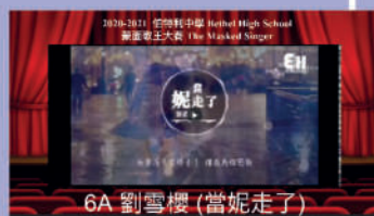
6A 劉雪櫻 (當妮走了)