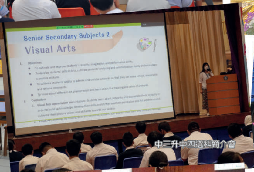
中三升中四選科簡介會