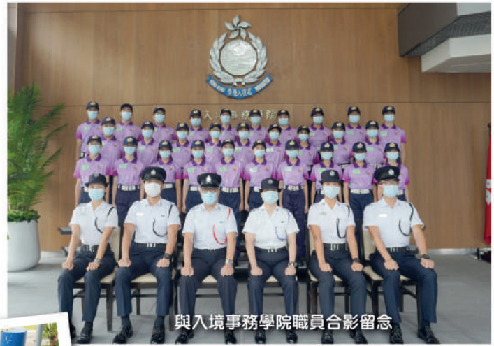
與入境事務學院職員合影留念