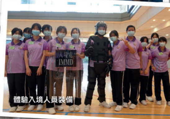
體驗入境人員裝備