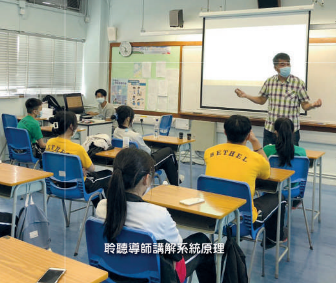
聆聽導師講解系統原理