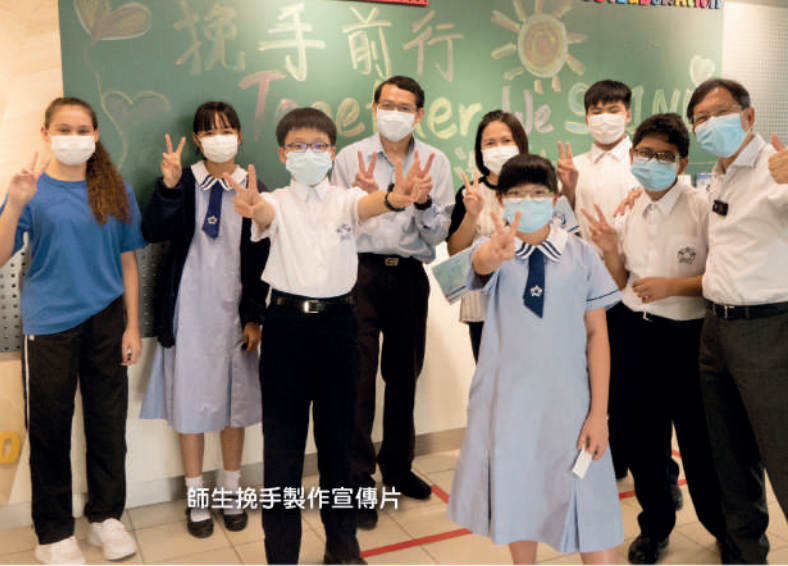
師生挽手製作宣傳片