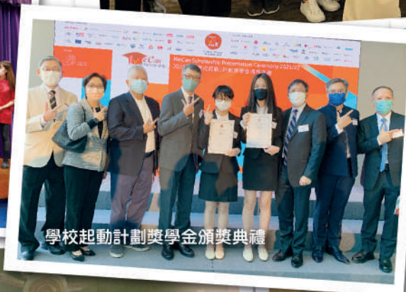
學校起動計劃獎學金頒獎典禮