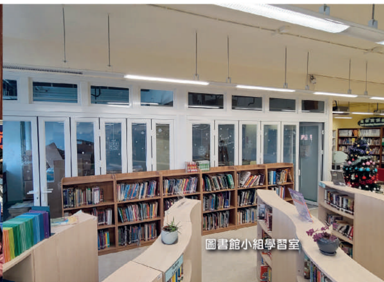
圖書館小組學習室