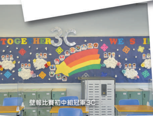
壁報比賽初中組冠軍3C