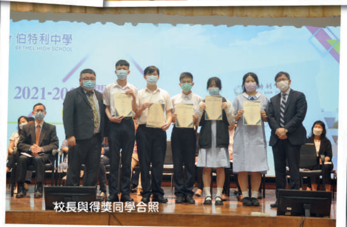
校長與得獎同學合照