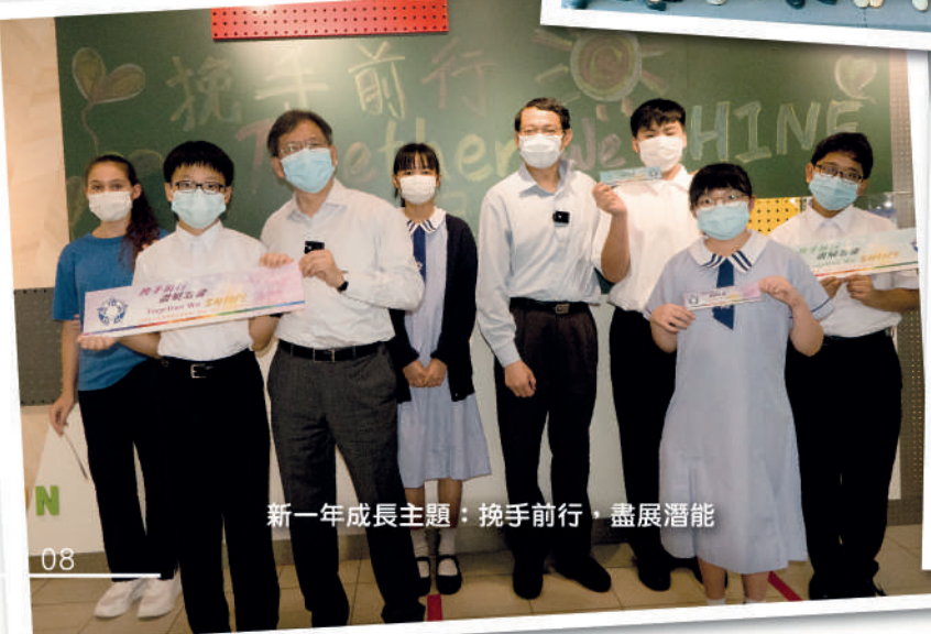
新一年成長主題：攜手前行·盡展潛能