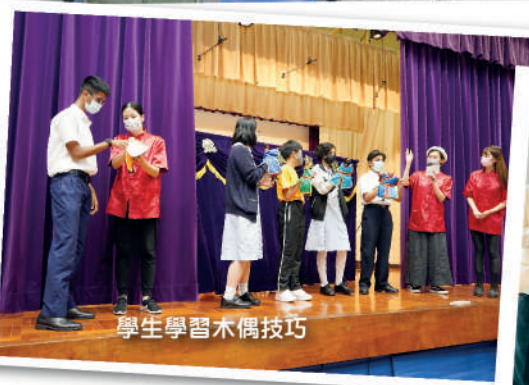
學生學習木偶技巧