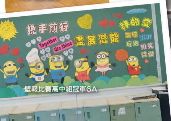
壁報比賽高中組冠軍6A