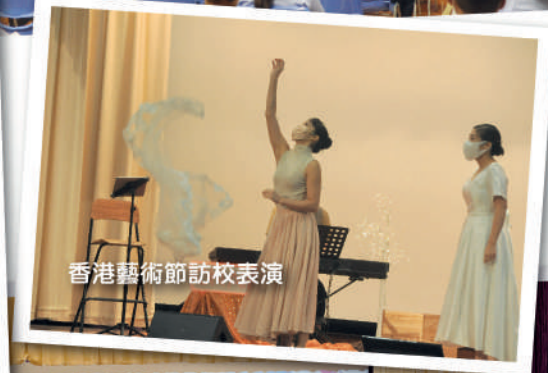
香港藝術節訪校表演