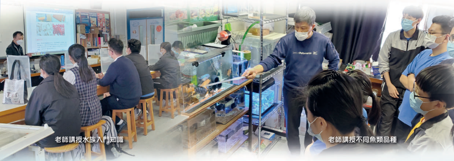
老師講授水族入門知識