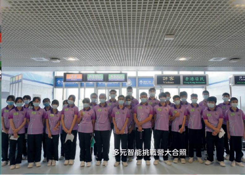
多元智能挑戰營大合照