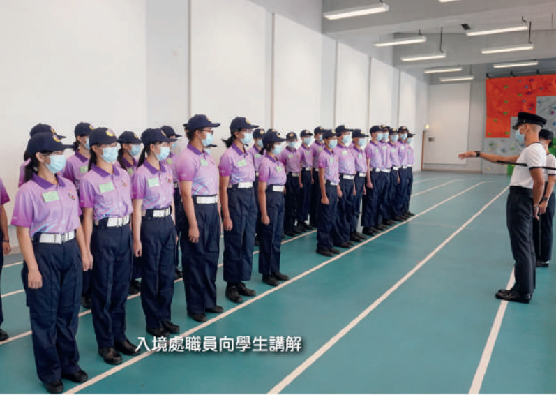
入境處職員向學生講解