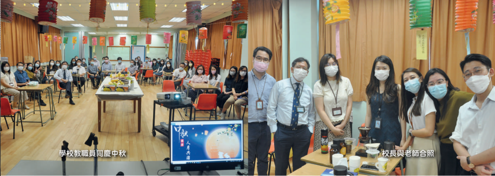
學校教職員同慶中秋