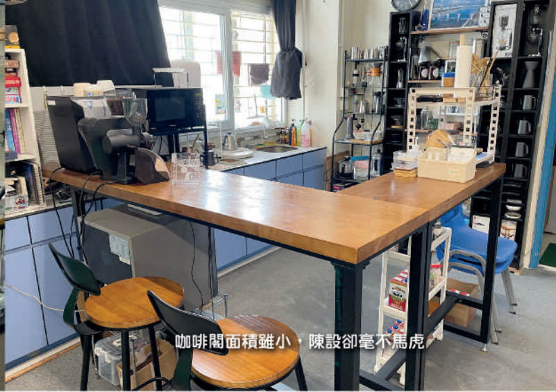
咖啡閣面積雖小，陳設卻毫不馬虎