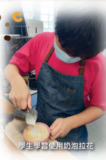
學生學習使用奶泡拉花

咖啡閣是本校校園咖啡師 (Campus Barista) 的主要練習場地，不同年級、不同能力、不同族裔的學生，都能在此聚首，享受咖啡沖調所帶來的樂趣與挑戰。咖啡閣由學生及導師共同打理，設有各類專門工具，學生經指導後，可以之實踐不同的咖啡沖泡技巧。學生除需要按導師要求出席常規練習外，亦可於其他課餘時間到咖啡閣作自主練習。練習期間所透出的咖啡香氣，不時吸引一眾師生駐足，咖啡閣亦漸漸成為師生的聚腳點。雖然防疫期間大家未能面對面品嚐校園咖啡師的作品，但能在繁忙的生活中騰出空間，放慢節奏，交流不同角度的知識與生活體會，這對老師、學生來說，都是難能可貴的時光。