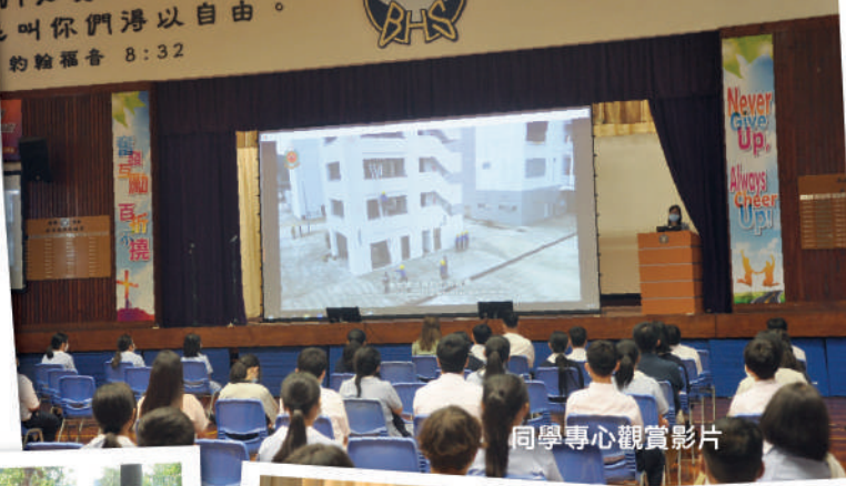
同學專心觀賞影片