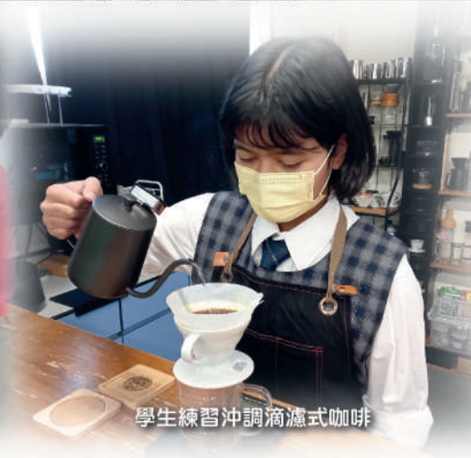
學生練習沖調滴濾式咖啡