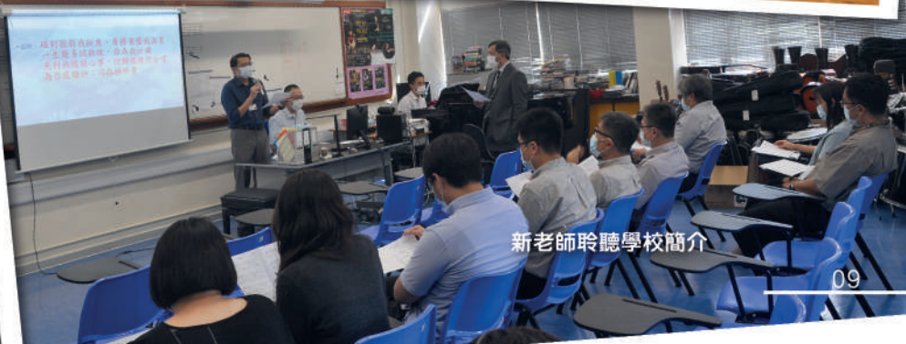
新老師聆聽學校簡介