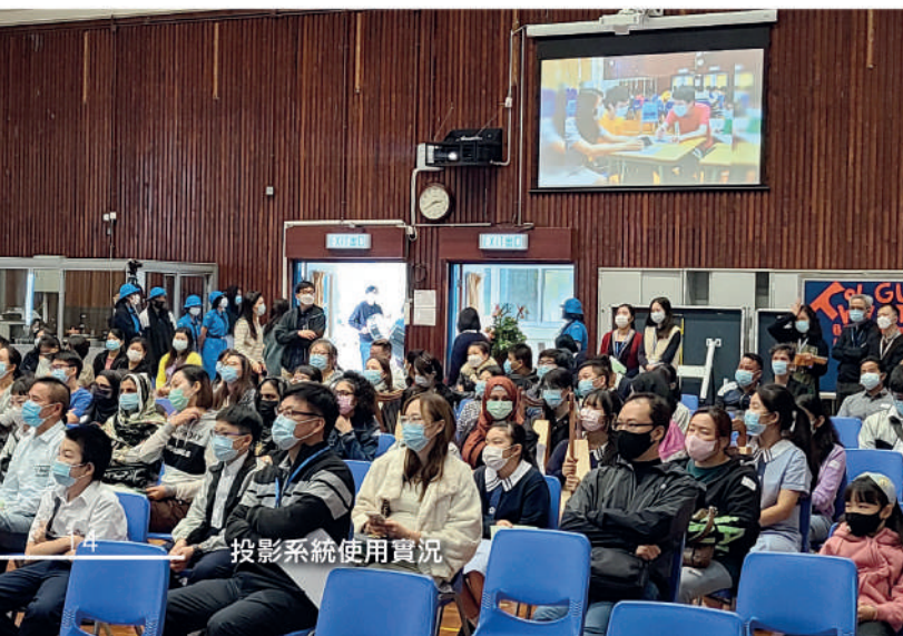
投影系統使用實況

培養學生自主學習，是近年重點發展項目之一，透過「小型學校改善工程計劃」，我們獲教育局支持，將圖書館內的活動室，改為兩個小組學習室，讓師生可以在學習室內進行小組學習及教學輔導之用，如有需要，更可將兩房之間的屏風收起，變成一個大的學習室。此外，小組學習室與圖書館是以玻璃摺門分隔，只要將摺門打開，變成開放式空間以配合圖書館舉辦不同活動如展覽及講座。小型學習室的基建及冷氣工程已經完成，待配置傢具及教學設施後便可開放予師生使用。