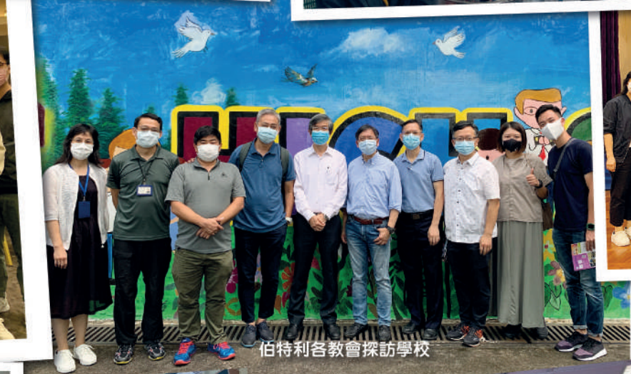
伯特利各教會探訪學校