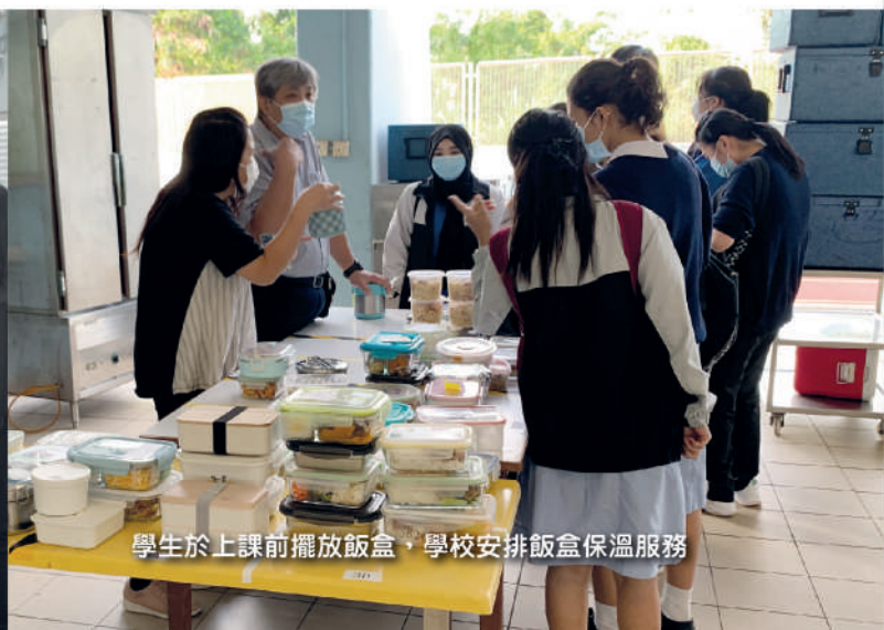
學生於上課前擺放飯盒，學校安排飯盒保溫服務