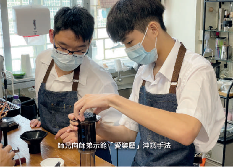
師兄向師弟示範「愛樂壓」沖調手法