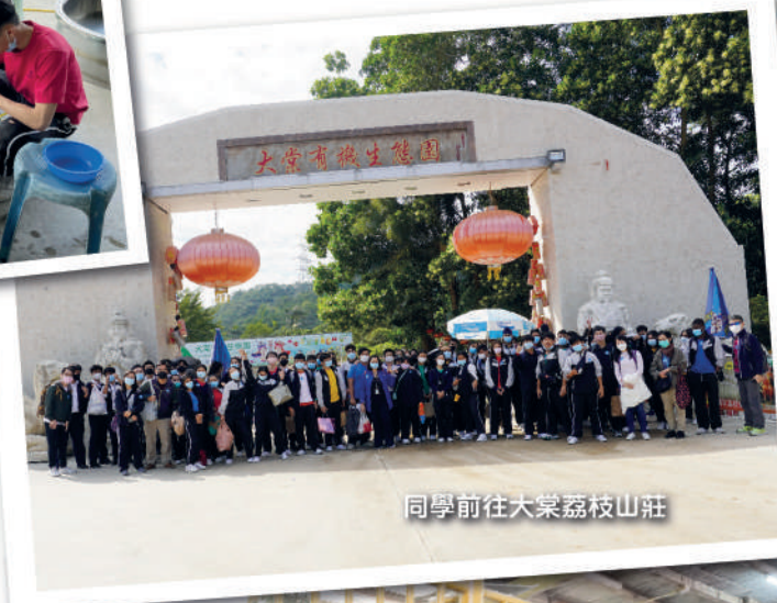
同學前往太堂荔枝山莊

本學年的戶外學習日，在11月11日舉行，同學分別前往錦田俱樂部和太堂荔枝山莊進行活動。同學在各場地進行集體遊戲、認識大自然動植物、或享受戶外野餐燒烤樂趣，歡度一天在戶外環境的學習。