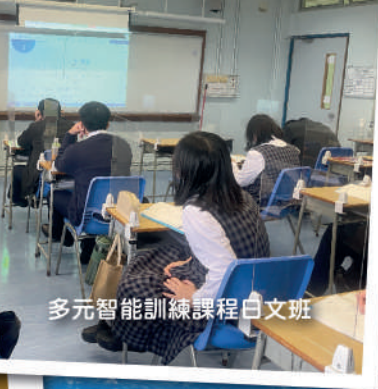
多元智能訓練課程白文班