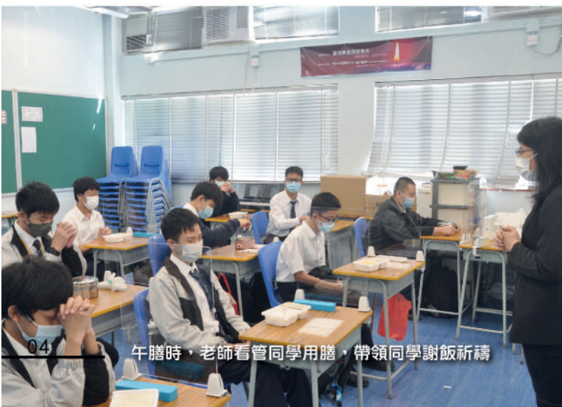
午膳時，老師看管同學用膳，帶領同學謝飯祈禱

學校恢復了全日面授課堂，全日課堂時間表已作調適，中四級應用學習模式二課堂、多元智能課程(MIP)及中一、二樂器班課堂及全校的課外活動，亦得以完全地進行。此外，學生需留校進行午膳，為了預防2019冠狀病毒病，學校更新了老師的工作及當值時間表，特意安排了由教師/學校人員於午膳時看管同學用膳。整體而言，全日面授課堂運作順利，學校得以重拾昔日全日課堂的氣氛。