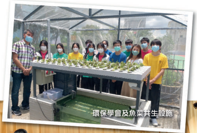
環保學會及魚菜共生設施

學校從11月開始，進行實體課外活動。為建立同學良好的自我形象和提升自信心，學校透過安排各種課外活動，發掘同學的體藝潛能。經過訓練後，同學參與學界比賽、校外交流或公眾表演，展現同學的才華和成就。本學年設有多項課外活動，在星期三放學後舉行，分為靈育、德育、學術、體育、音樂等類型。