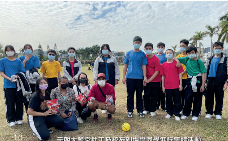
元朗大會堂社工及校友到場與同學進行集體活動