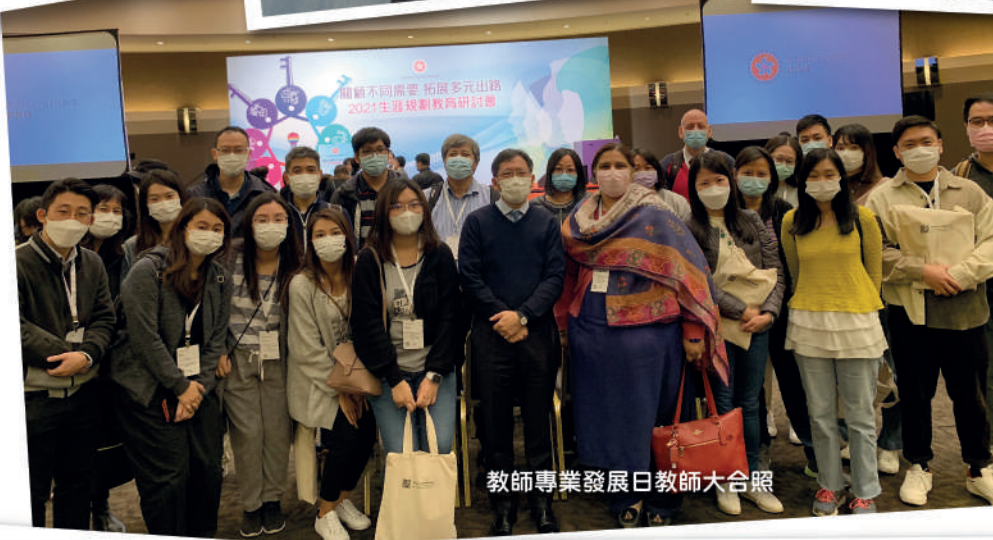
教師專業發展日教師大合照